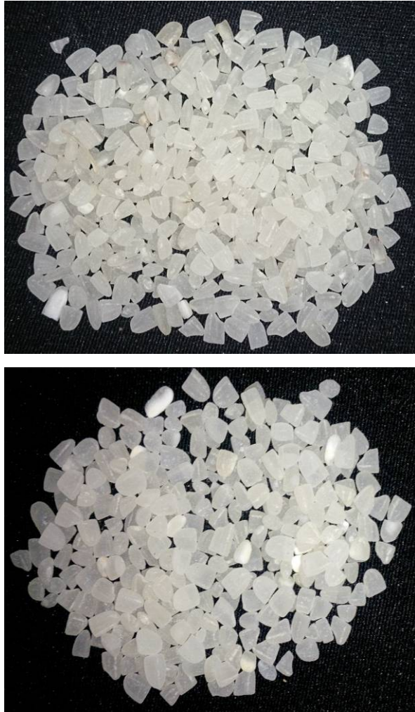
Gambar 3. Contoh Beras Patah Dan Butir Mengapur Yang Berada Diantara Beras Patah.

Gambar berikut menunjukkan contoh beras patah dan butir mengapur yang berada diantara beras patah.