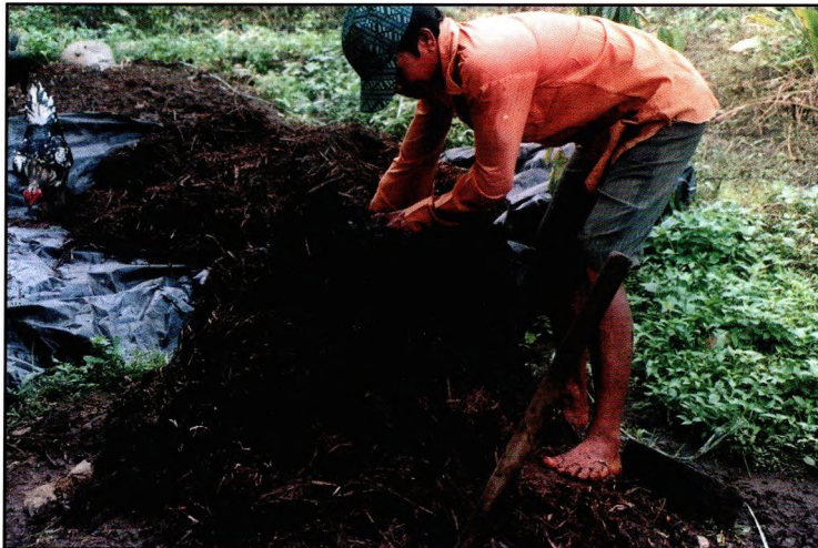
Gambar 6. Kondisi kompos dilapang umur 3 minggu.