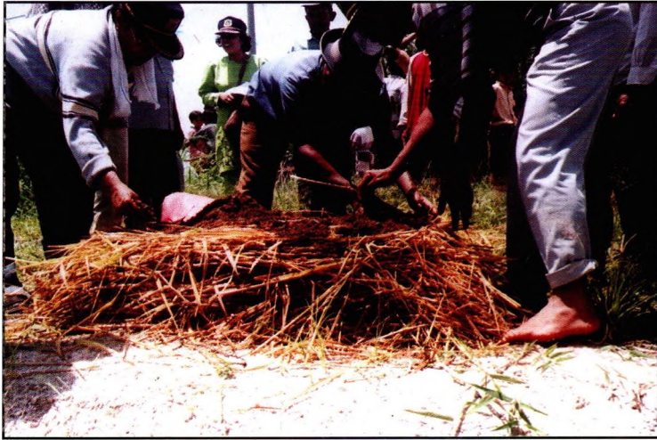
Gambar 3. Proses pembuatan kompos di lapang. Penebaran aktivator diatas lapisan I.