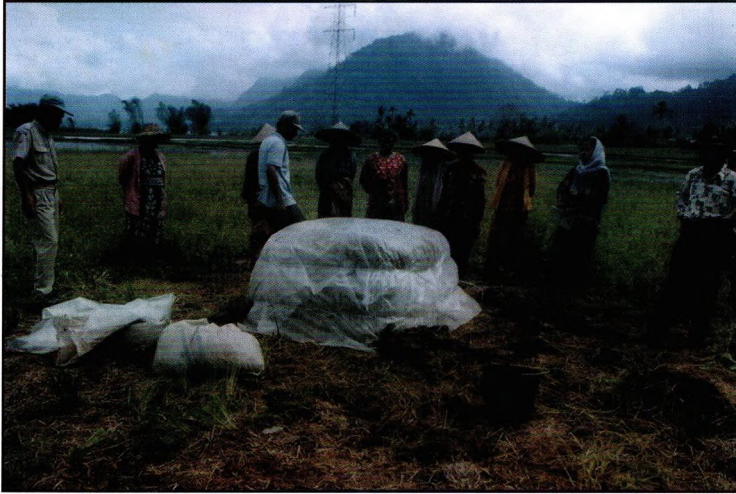
Gambar 5. Proses pembuatan kompos di lapang. Penutupan tumpukan dengan plastik.