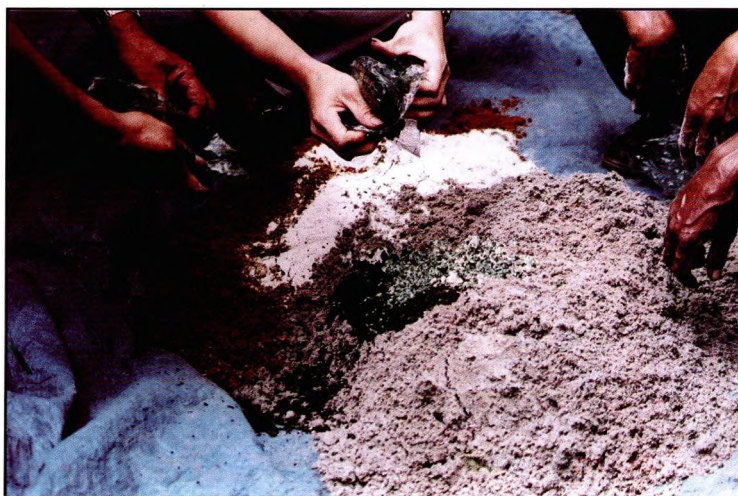
Gambar 2. Aktivator Formulasi BPTP terdiri dari T. harzianum , pupuk kandang, Urea, SP36, kapur (doc. Yanti Mala 2000).