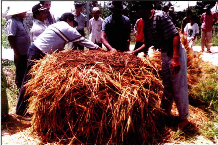
Gambar 4. Proses pembuatan kompos di lapang. Penebaran aktivator untuk lapisan IV.