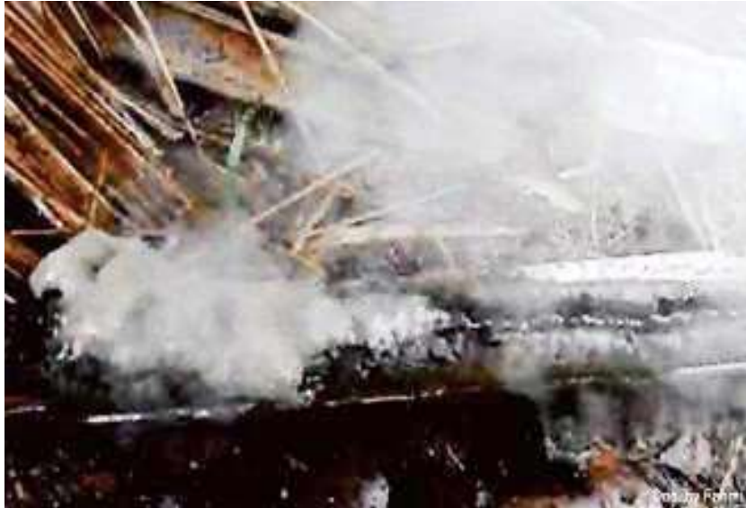
Gambar 4. Gelembung dan Asap Putih yang Muncul pada Lapisan Tanah yang Mengandung Bahan Sulfidik Setelah Ditetesi Peroksida ( H_2O_2 30 %)

karena pemberian H_2O_2 terhadap pirit menyebabkan terbentuknya asam sulfat + mineral besi sulfat + panas. Reaktivitas dan waktu munculnya gelembung/busa dan asap putih merupakan suatu indikasi dari tingginya kandungan pirit. Menurut Noor (2004) bahwa semakin cepat dan banyak gelembung/busa dan asap putih yang muncul maka kandungan pirit dari bahan tersebut adalah tinggi. Kadar pirit dalam suspensi tersebut dapat diestimasi melalui pengukuran pH larutannya, jika pH larutan <2,5 merupakan indikasi kandungan pirit yang sangat tinggi (Notohadiprawiro, 1985).