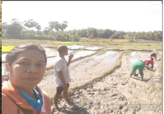
Gambar 12: Pengolahan tanah.