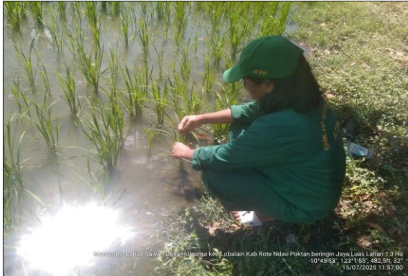
Gambar 11: Monitoring lahan sawah Poktan Beringin Jaya luas lahan 1,3 Are.