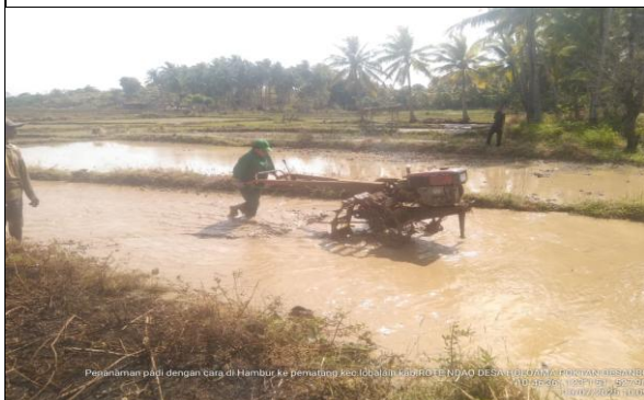
Gambar 9: Pengolahan tanah menggunakan traktor R2.