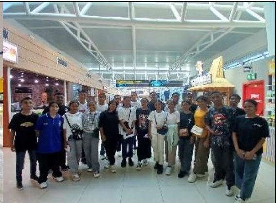
Gambar 2: Kegiatan keberangkatan para siswa peserta PKL di bandara El Tari Kupang menuju Rote Ndao pada pukul 11.00 Wita.