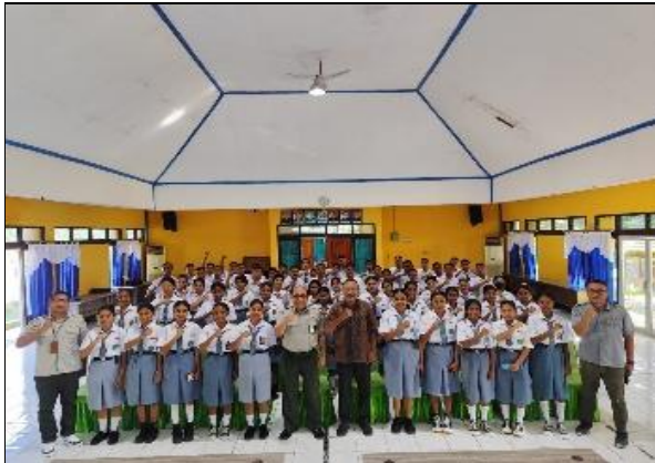
Gambar 1: Kegiatan pelepasan peserta PKL di aula SMK PP NEGERI Kupang menuju tempat PKL.