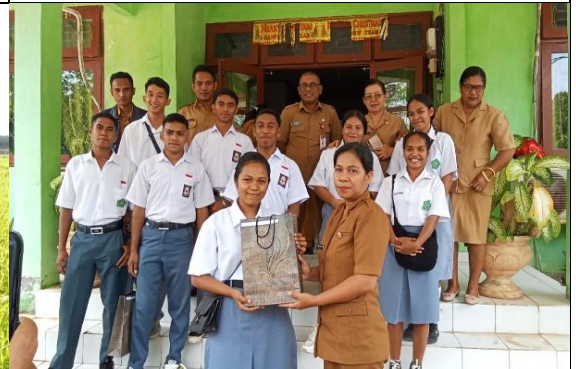
Gambar 28: Pelepasan siswa-siswi SMK PP N KUPANG.