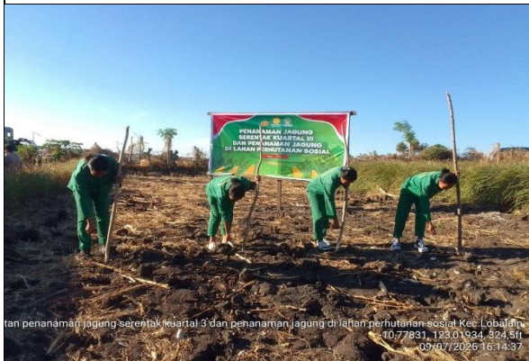
Gambar 7 :Kegiatan penanaman jagung serentak ke III