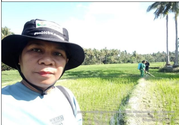
Gambar 19: Penyiangan/penyulaman pada tanaman padi menggunakan Herbisida.