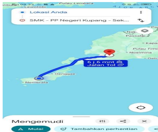
Gambar 1. Lokasi Praktek Kerja Lapangan (PKL)

Kegiatan Praktek Kerja Lapangan (PKL) dilaksanakan mulai dari tanggal 7 Juli 2025 sampai dengan 29 September 2025, yang berlokasi di Desa Holoama, kecamatan Lobalain, kabupaten Rote Ndao, Provinsi nusa tenggara timur.