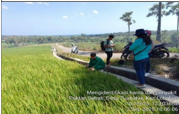
Gambar 25: Identifikasi hama/penyakit pada tanaman padi.