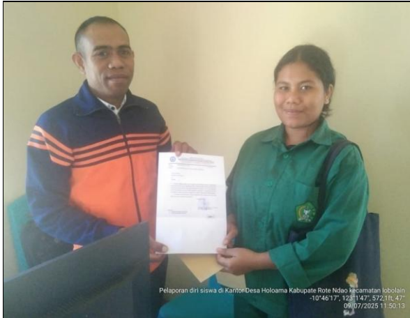
Gambar 5 : Siswa melaporkan diri ke kantor Desa Rakyat Holoama sekaligus meminta izin untuk melakukan kegiatan pkl dan penelitian.