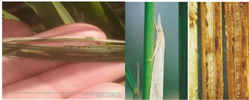
Gambar 3. Jenis serangan Penggerek Batang

Berdasarkan hasil identifikasi dari ciri-ciri serangan hama tersebut, maka dapat disimpulkan bahwa tanaman padi tersebut terserang Hama Penggerek Batang ( Scirpophaga Innotata ). Hama ini sangat merugikan petani karena larvanya menggulung dan memakan daun padi sehingga mengganggu proses fotosintesis tanaman kemudian menyerang tanaman padi dan menyebabkan kerusakan pada batang, sehingga mengurangi produksi gabah.