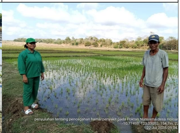
Gambar 14: Kegiatan Penyuluhan tentang hama penyakit pada jenis padi inpari.