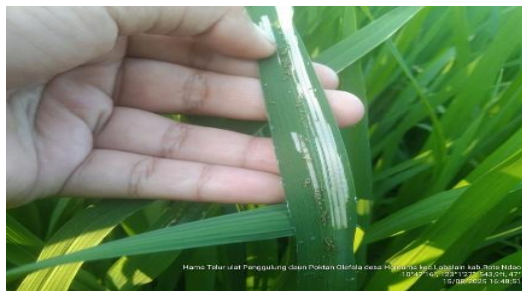
Gambar 2. Jenis telur ulat yang terdapat pada menggulung daun padi

Berdasarkan keluhan masyarakat tani kepada penyuluh lapangan terkait serangan hama pada areal pertanaman padi, maka penyuluh bersama dengan siswa PKL melakukan identifikasi jenis hama dan tingkat kerusakan yang diakibatkan. Adapun gejala dan ciri-ciri serangan hama tersebut di antaranya, terdapat banyak kupu-kupu yang beterbangan di hamparan tersebut, hal ini mengindikasikan bahwa pada areal tersebut telah menjadi tempat hidup kupu-kupu, terdapat daun yang berwarna putih dan menggulung. Daunnya yang menggulung dibuka dan didapati telur dan juga ulat yang menempel pada daun. Ulat tidak hanya menggerak daun tetapi juga batang tanaman padi. Ciri-ciri lainnya juga ditandai dengan pucuk layu, ada yang kering bahkan ada yang mati.