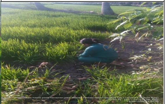
Gambar 22: Pembersihan gulma pada tanaman padi.