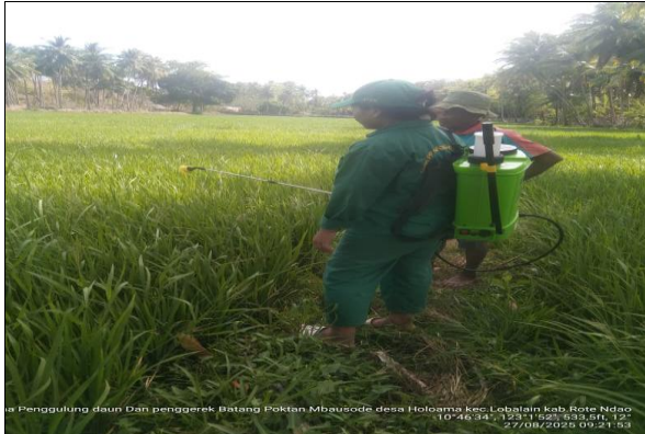
Gambar 23: Pengendalian hama penggerek batang dengan cara semprot menggunakan obat insektisida.