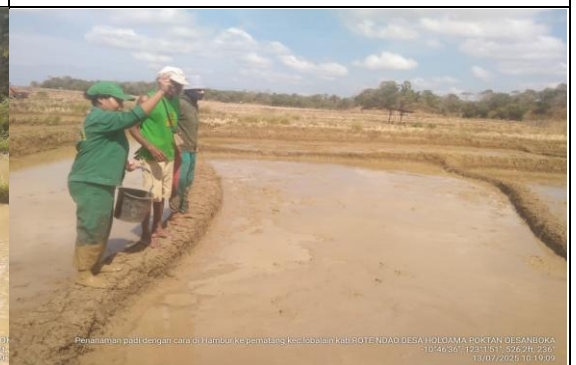
Gambar 10: Penanaman padi dengan cara di hambur ke dalam pematang.