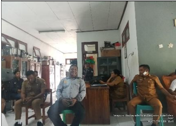
Gambar 3: Para siswa melaporkan diri kepada Dinas pertanian kab. Rote Ndao sekaligus meminta izin untuk melakukan kegiatan pkl di Kab. Rote Ndao.