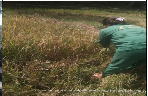
Gambar 26: Pemanenan padi tahap ke-1.