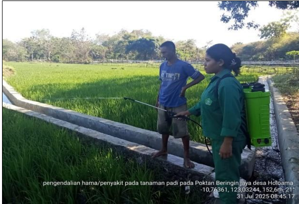
Gambar 17: Pengendalian hama penggerek batang.