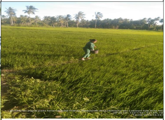
Gambar 20: Pemberian pupuk NPK pada tanaman padi.