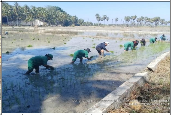
Gambar 16: Penanaman jajar legowo 4:1.