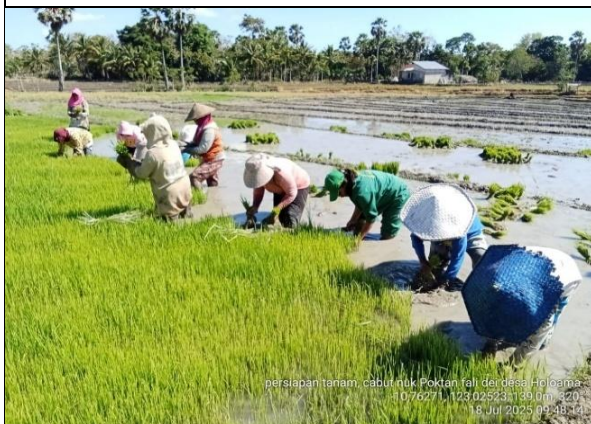
Gambar 13: Persiapan tanam, cabut nuk padi.