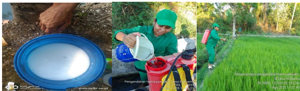
Gambar 6. Pencampuran obat hama insektisida dengan air dan penyemprotan

Untuk aplikasi obat insektisida dapat dilakukan dengan mencampur air dengan hasil percampuran obat hama yang sudah jadi (obat insektisida berwarna putih) dengan dosis pertengki semprot 16 liter. Penyemprotan dilakukan pada pagi atau sore hari, pagi hari hingga jam sembilan saat angin tidak terlalu kencang dan sinar matahari tidak terlalu terik, sore hari mulai dari jam tiga hingga jam lima sore, agar pestisida tidak menguap sebelum terserap tanaman.