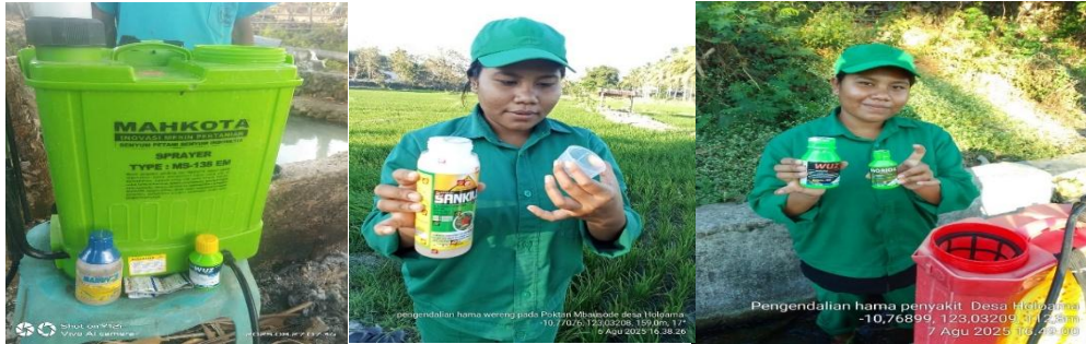
Gambar 4. Alat Dan Bahan Pencampuran Obat Hama (Insektisida)