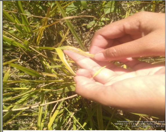
Gambar 6 : Mengidentifikasi hama dan penyakit pada tanaman padi.