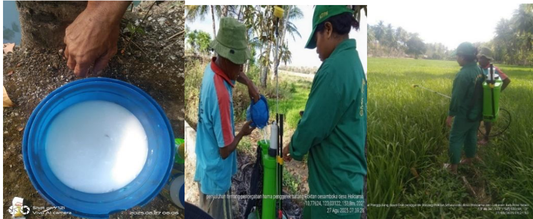
Gambar 5. Tahapan dan langkah-langkah pencampuran obat hama (insektisida).