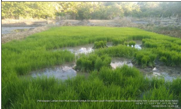
Gambar 21 : Persiapan lahan dan nuk padi yang sudah siap untuk ditanam pada petak sawah.