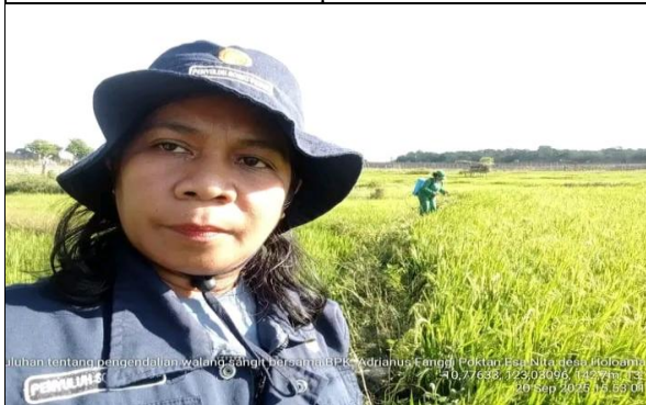
Gambar 27: Pengendalian hama walang sangit pada tanaman padi.