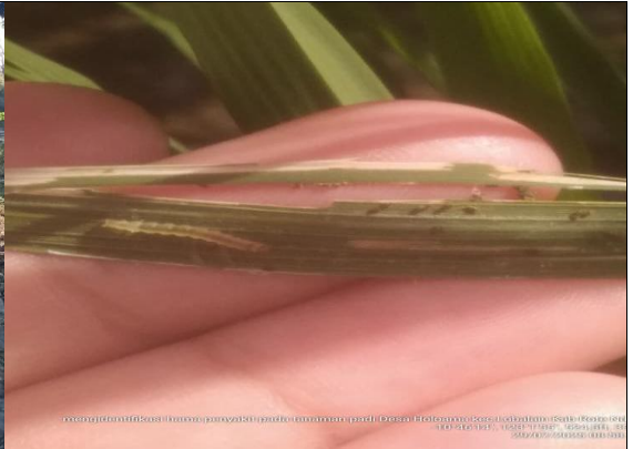
Gambar 18: Hama ulat penggerek batang pada tanaman padi.