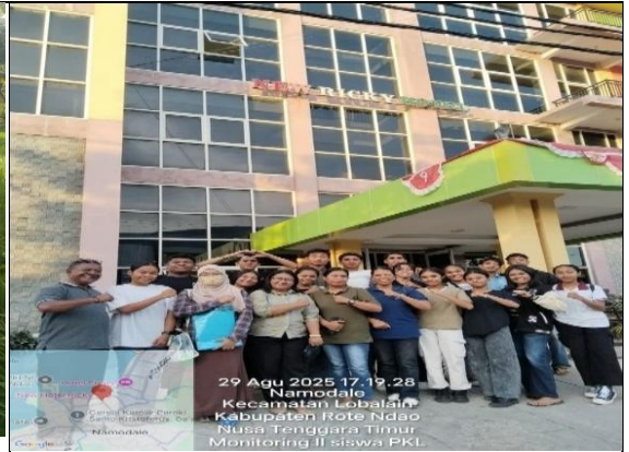
Gambar 24: Monitoring tahap Ke 2.