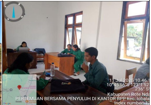
Gambar 8 : Pertemuan bersama dengan penyuluh pertanian di Kantor Bpp Holoama.