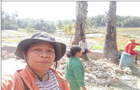
Gambar 15: Kegiatan CPCL bantuan Aspirasi padi.