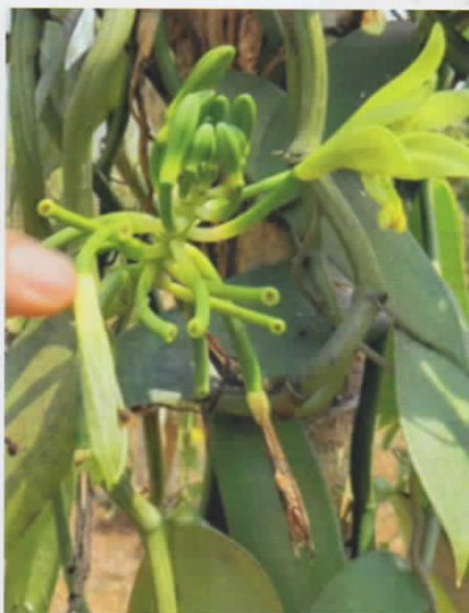
Gambar 1. Bunga dan buah muda tanaman vanili

Pembungaan pada tanaman vanili sangat menentukan keberhasilan pengembangan tanaman vanili. Munculnya bunga adalah awal dari penentuan keberhasilan tanaman untuk berbuah. Setelah tanaman vanili berbunga, bunga mekar harus diserbuki atau dikawinkan. Tanpa penyerbukan maka bunga tidak akan menjadi buah.