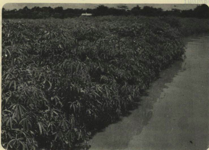
Gambar 3. Tanaman kenaf didaerah banjir di Kudus.

Figure 3. A Kenaf plantation in a flooded area in Kudus.