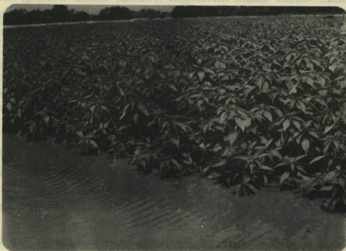
Gambar 4. Tanaman jute tetap tumbuh subur meskipun tergenang air sampai sedalam 1.5 — 2 m.

Figure 3. A Kenaf plantation in a flooded area in Kudus.