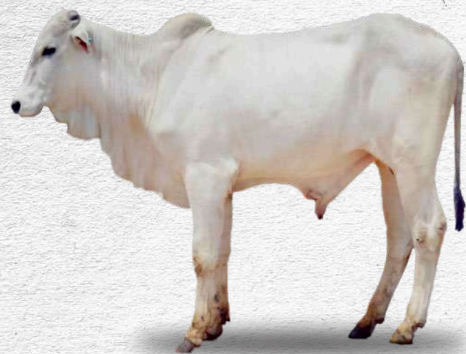
Bibit sapi PO jantan muda

Bibit jantan: sehat; tidak cacat fisik; organ reproduksi normal; dan memiliki silsilah minimum satu generasi.