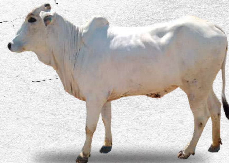
Bibit sapi PO betina dewasa