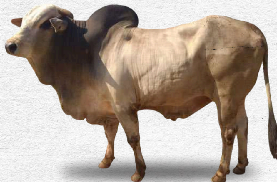
Bibit sapi PO jantan dewasa