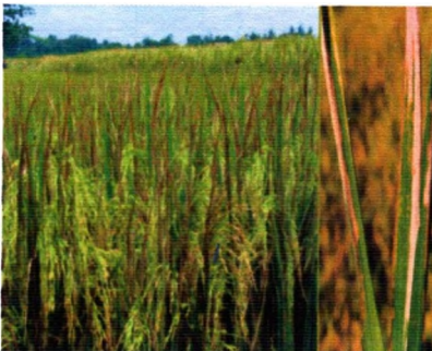
Gambar pertanaman padi terserang hawar daun bakteri

Gejala timbul 1-2 minggu setelah padi dipindah dari persemaian. Daun yang skit berwarna hijau kelabu, mengering, helaian daunnya melengkung, diikuti oleh melipatnya helaian daun itu sepanjang tulang daunnya. Umumnya serangan terjadi pada daun-daun yang lebih tua.