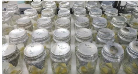
Gambar 1. Penyediaan sumber eksplan akar dari siung bawang putih in vitro

panjang 1-1.5 cm dan ditanam pada media perlakuan untuk mendapatkan kalus melalui teknik embryogenesis somatik.