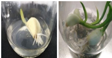
Gambar 2. Siung bawang putih steril ditanam dalam media MS menghasilkan akar untuk dijadikan bahan eksplan. (a) umur 5 hari dan (b) umur 10 hari