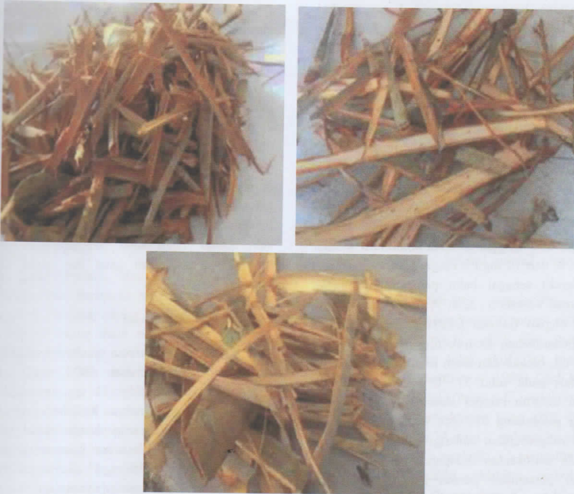
Gambar 1. Sampel kulit batang Calophyllum spp., C. pulcherrimum (kiri), C. soulattri (tengah) dan C. teysmannii (kanan).