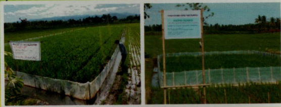
Gambar 4. Tanaman perangkap dalam TBS yang ditanam 3 (tiga) minggu lebih awal dibandingkan tanaman sekitarnya.