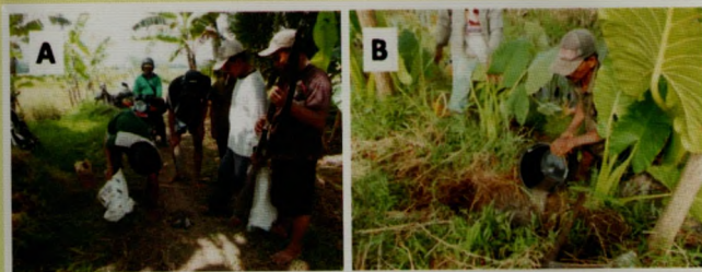
Gambar 7. Gerakan gropyok dan tembak tikus (A), Gerakan penggenangan lubang tikus (B).

Beragam cara pengendalian tikus dengan teknologi setempat dapat dilakukan, seperti gropyok malam hari (nyuluh), penggenangan, bunyi-bunyian, penjeratan, penjaringan, tembak, dan lainnya.