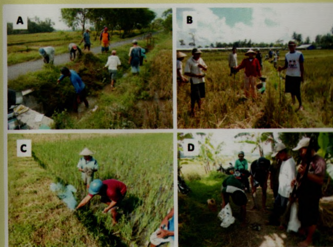
Gambar 1. Sanitasi habitat (A), Gropyokan massal (B), Fumigasi/pengemposan (C), Cara lokal (D).

Fumigasi atau pengemposan dilakukan menggunakan asap belerang. Dilakukan selama masih dijumpai sarang tikus, terutama pada stadia generatif padi. Agar tikus lebih cepat mati, lubang tikus ditutup dengan lumpur setelah difumigasi, dan sarang tidak perlu dibongkar.