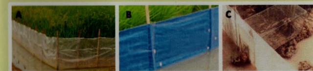
Gambar 3. Pagar plastik TBS dengan plastik bening (A), dan terpal (B). Bagian bawah pagar plastik selalu terendam air dan perhatikan posisi ajir bambu, dan Bubu perangkap dan cara pemasangannya (C).

TBS (Trap Barrier System) atau Sistem Bubu Perangkap terdiri atas: Tanaman perangkap yaitu padi yang ditanam 3 minggu lebih awal untuk menarik tikus dari sekitarnya. Petakan TBS berukuran 25m x 25m dikelilingi dengan pagar plastik, Pagar plastik atau terpal setinggi 60 cm ditegakkan dengan ajir bambu dan bagian bawahnya harus terendam air, agar tikus tidak mampu menerobosnya, Bubu perangkap, dipasang pada setiap sisi dalam TBS (menghadap keluar) dibuat dari ram kawat dengan ukuran 40cm x 20cm x 20cm.