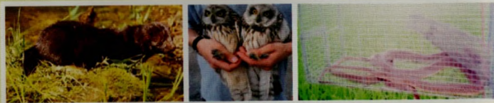
Gambar 5. Musuh alami (predator/pemangsa) tikus

Beragam musuh alami tikus antara lain musang, burung hantu ( Tyto alba ) dan ular dilestarikan sebagai predator atau pemangsa tikus.