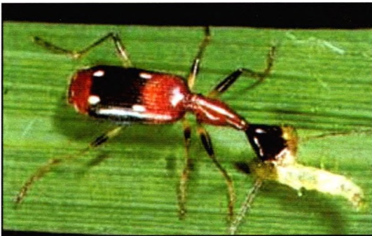
Gambar 9. Kumbang ( Ophionea nigrofasciata )