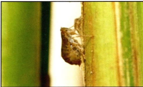
Gambar 4. Imago Wereng Coklat (Brakhiptera)

Jumlah makroptera akan semakin banyak jika populasi pada stadium nimfa semakin tinggi sedangkan makanan yang tersedia semakin berkurang baik kualitas maupun kuantitasnya. Imago dan nimfa Wereng Coklat biasanya tinggal pada bagian pangkal batang tanaman padi, tetapi bila populasi sangat tinggi serangga banyak juga ditemukan pada helai daun, daun bendera, bahkan pada malai (Kalshoven, 1981).