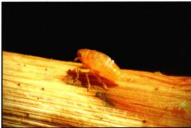
Gambar 3. Nimfa Wereng Coklat

Periode nimfa ini bervariasi dari 13-15 hari (Kalshoven, 1981). Nimfa instar pertama berwarna putih dan instar selanjutnya berwarna coklat, panjang tubuhnya rata-rata 0,6 mm, sedangkan nimfa instar terakhir dapat mencapai panjang 1,9 mm (Natawigena, 1990).