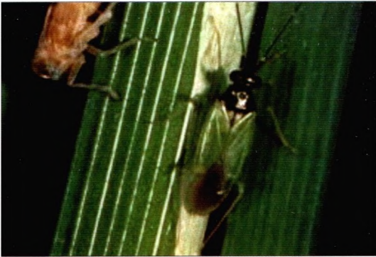
Gambar 8. Kepik ( Cyrtorhinus lividipennis Reuter) (Sumber : Shepard et al , 1994)