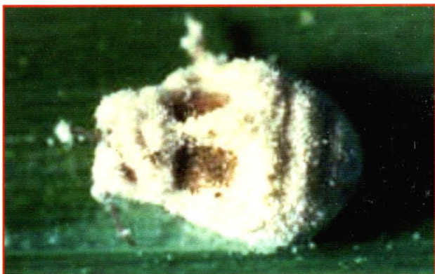
Gambar 10. Wereng coklat terserang Beauveria bassiana