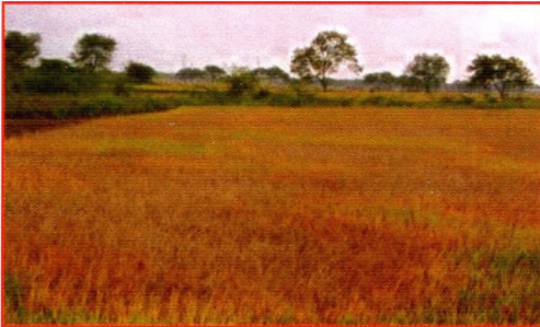
Gambar 5. Tanaman padi terserang wereng coklat/hopperburn

pertanaman mati. Serangan wereng coklat terjadi sangat cepat. Tanaman yang rusak mengalami hopperburn biasanya terjadi pada saat populasi wereng coklat pada generasi ke-3, pada generasi ini nimfanya sangat banyak dan hidup berdesakan, pada satu rumpun padi dapat mencapai 400 – 1.000 ekor wereng. Pada kondisi ini pertanaman akan mengalami kematian dan menyebabkan puso/gagal panen.