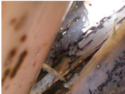
Gambar 13. Batang pisang yang diserang penggerek batang

Kerusakan akibat hama ini ditandai dengan adanya lubang di sepanjang batang semu. Cara pengendaliannya yaitu: Dengan sanitasi kebun, menggunakan musuh alami Plaesius javanicus dan penggunaan insektisida berbahan aktif Carbofuran.