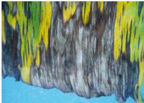
Gambar 11. Daun pisang terjangkit penyakit sigatoka

Perkembangan penyakit dipengaruhi oleh beberapa hal, antara lain jenis pisang, umur tanaman, faktor iklim dan lain-lain. Jenis pisang komersial yang mudah terserang antara lain: kelompok Ambon (Cavendish dan Gross Michell), Mas, Barangan dan Raja sere. Kondisi lingkungan yang baik untuk perkembangan penyakit yaitu pada musim hujan.