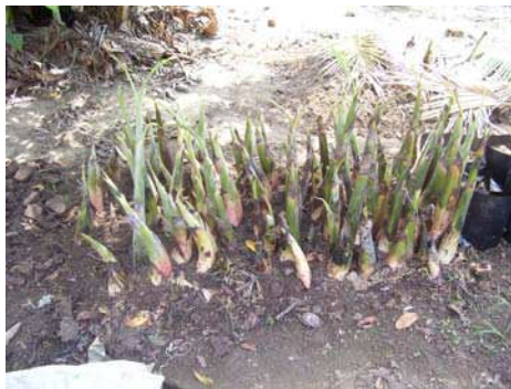
Gambar 2. Anakan pisang siap tanam