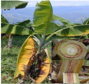
Gambar 8. Ciri khas tanaman yang terkena penyakit layu Fusarium