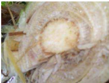
Gambar 10. Layu bakteri/darah pada bonggol