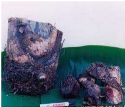
Gambar 5. Bonggol pisang setelah panen dan bit hasil pembelahan mata tunas dari bonggol