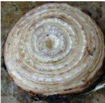
Gambar 3. Bonggol anakan pisang yang telah dimatikan titik tumbuhnya