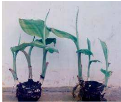
Gambar 4. Tunas yang tumbuh dari bonggol siap dipisahkan