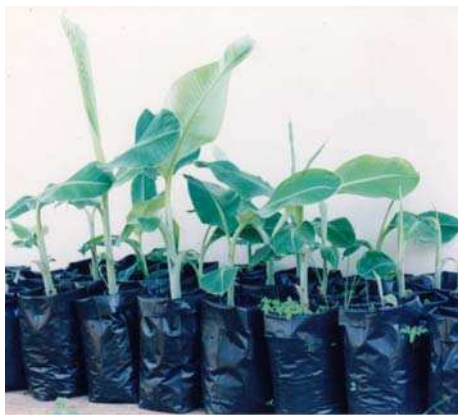
Gambar 6. Semai bit umur 1 bulan