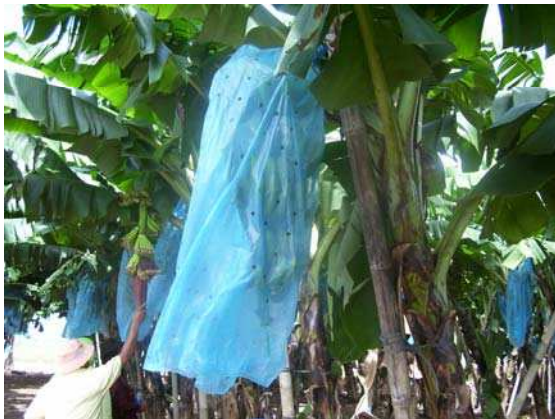
Gambar 7. Pengkerodongan buah dengan pelastik biru

Membersihkan daun sekitar tandan terutama daun yang sudah kering. Selain itu membuang buah pisang yang tidak sempurna yang biasanya pada 1-2 sisir terakhir, dan diikuti dengan pemotongan bunga jantan agar buah pada tandan di atasnya dapat tumbuh dengan baik. Kemudian buah dibungkus/dikerodong dengan kantong plastik warna biru ukuran 1 m x 45 cm. Hal ini dilakukan untuk melindungi buah dari kerusakan oleh serangga atau karena gesekan daun. Setelah dibungkus, tandan yang mempunyai masa pematangan yang sama dapat diberi tanda (misal dengan tali rafia warna yang sama). Hal ini untuk menentukan waktu panen yang tepat sehingga umur dan ukuran buah seragam. Agar tanaman tidak roboh sebelum buah dipanen, maka dapat ditopang dengan bambu atau dengan mengikat pangkal tandan dengan kabel atau tali yang dibentang diantara barisan tanaman pisang.