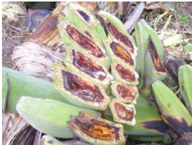
Gambar 9. Ciri khas layu bakteri/darah pada buah