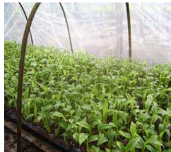
Gambar 1. Bibit pisang dari kultur jaringan