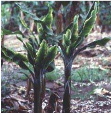
Gambar 12. Tanaman pisang yang terjangkit penyakit kerdil

menggunakan insektisida sistemik,eradikasi/pembongkaran rumpun yang sakit.