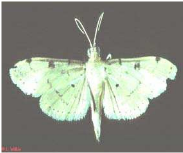
Gambar 14. Hama yang menyebabkan burik buah

Cara pengendaliannya yaitudengan membungkus tandan buah saat bunga akan mekar.