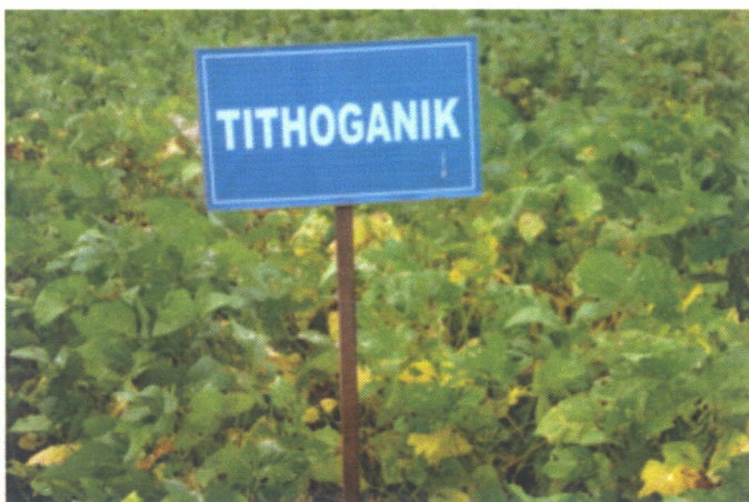
Gambar 1. Penampilan tanaman kedelai yang diberi Tithoganik