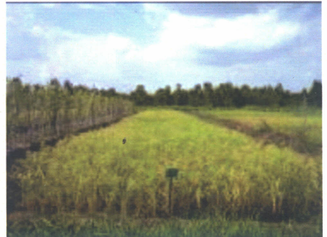
Gambar 3. Keragaan tanaman padi di lahan sulfat masam pada perlakuan fosfat alam jenis Algeria