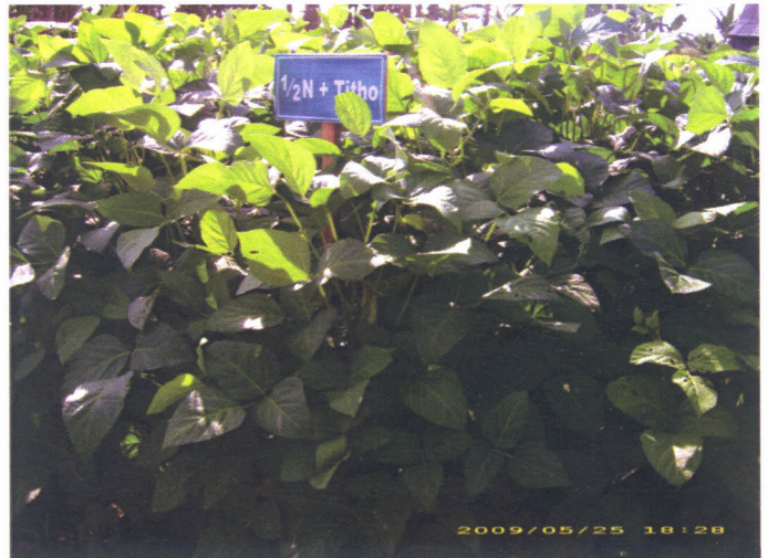
Gambar 2. Penampilan tanaman kedelai yang diberi \frac{1}{2} N Tithoganik

Hasil penelitian menunjukkan bahwa Tithoganik 1 t/ha dapat mensubstitusi \frac{1}{2} dosis rekomendasi pupuk NPK anorganik dan meningkatkan hasil sebesar 69,21% dibandingkan pupuk NPK anorganik saja dengan dosis rekomendasi (22,5 kg N + 67,5 kg P 2 O 5 + 30 kg K 2 O, (Gambar 1, 2 dan 3). (Mukhlis dan Isri Hayati - Balittra)