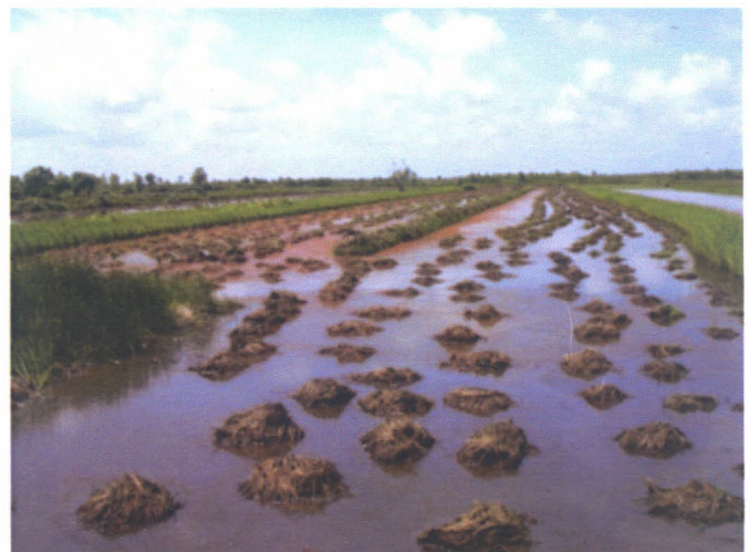
Gambar 2. Ongkongan ( Puntalan ) gulma dan jerami padi