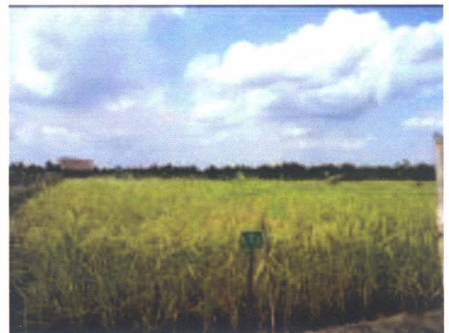
Gambar 4. Keragaan tanaman padi di lahan sulfat masam pada perlakuan fosfat alam jenis Tunisia