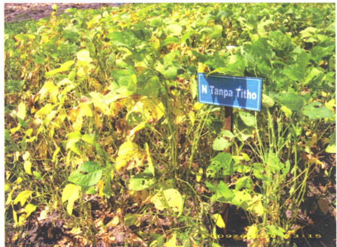
Gambar 3. Penampilan tanaman kedelai yang diberi N tanpa Tithoganik