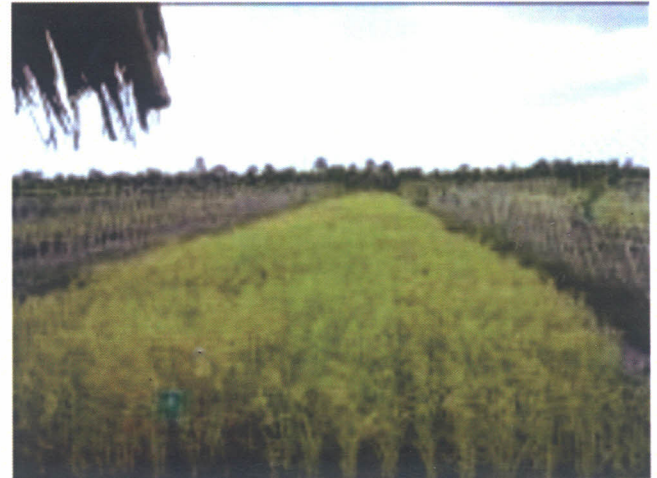
Gambar 2. Keragaan tanaman padi di lahan sulfat masam pada perlakuan fosfat alam jenis Maroko