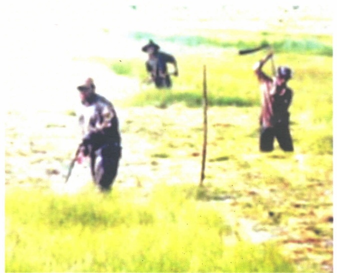
Gambar 1. Tajak merupakan alat yang digunakan untuk menebas gulma dan jerami padi

( Haryatun dan Dakhyar Nazemi - Balittra )