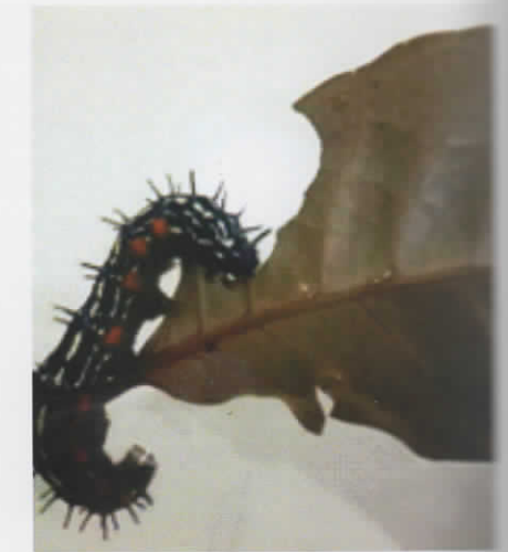
Gambar 5. Ulat daun ungu saat memakan daun ungu

Rearing (perbanyakan masal serangga) penting untuk dilakukan untuk mendapatkan D. bisaltidae dalam jumlah banyak dan seragam sehingga data yang didapatkan untuk penelitian lebih valid. Rearing Doleschallia spp. yang dilakukan di Balitro tetap menggunakan daun ungu sebagai makanan untuk larva, meskipun penelitian lain yang dilakukan Winanti