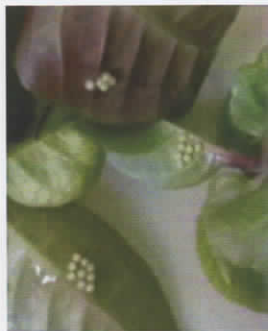
(a) Fase telur