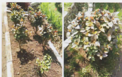
Gambar 1. Tanaman Daun Ungu/Handeleum (Lokasi : Balitro)

Tanaman daun ungu ( G. pictum ) (Gambar 1) memiliki beberapa nama lain di berbagai daerah, antara lain handeleum (Sunda), wungu (Jawa), karotong (Madura), temen (Bali), daun putri (Ambon), dan kabi-kabi (Ternate). Tanaman ini memiliki mahkota bunga berwarna merah tua dengan perakaran tunggal. Tanaman daun ungu berasal dari Papua Nugini dan Polinesia kemudian diperkenalkan ke Indo-Cina, Semenanjung Malaya, Filipina, dan Indonesia. Di Jawa, daun ungu tumbuh sampai pada 1.250 mdpl. Tanaman ini dibudidayakan sebagai tumbuhan pagar dan tumbuhan hias. Meskipun dapat tumbuh pada lahan ternaungi, tanaman ini tetap membutuhkan penyiangan yang cukup. Perbanyakannya biasanya dilakukan secara vegetatif dengan stek batang, satu stek batang minimal terdapat sepasang daun (Widiyastuti et al. , 2015).