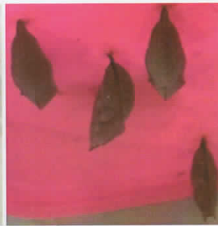
(e) Fase Pupa

(2010) menunjukkan bahwa tanaman gulma Asystasia gangetica (rumput israel) juga dapat digunakan sebagai pakan D. bisaltidae . Bahkan pada pengujian preferensi, D. bisaltidae mengkonsumsi daun A. gangetica lebih banyak daripada daun G. pictum . Siklus hidup D. bisaltidae pada pemberian daun G. pictum juga lebih singkat dibandingkan dengan pemberian daun A. gangetica .