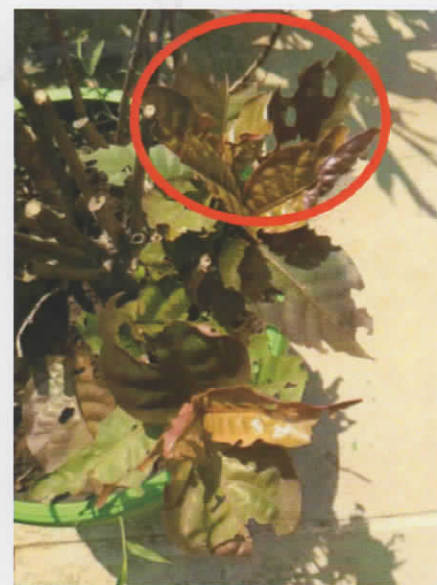
Gambar 2. Contoh kerusakan akibat serangan ulat daun ungu

Serangan ulat dari genus Doleschallia biasanya mudah ditemukan di tanaman daun ungu (Gambar 2) dan ulat ini biasanya sembunyi di bawah daun pada siang hari (Gambar 3). Meskipun, awalnya tercatat hanya spesies Doleschallia polibete yang menyerang tanaman daun ungu, namun, penelitian yang dilakukan oleh Sartiami et al. (2009) membuktikan bahwa terdapat tiga spesies yang menyerang tanaman daun ungu di Indonesia yaitu D. bisaltidae di Jawa Barat, D. nacar di Maluku, dan D. hexophthalmos di Papua. Adanya D. bisaltidae di daerah Jawa Barat ini juga dibuktikan oleh Sanjaya et al. (2016) yang menemukan adanya D. bisaltidae di Botanical Garden UPI (Universitas Pendidikan Indonesia) Bandung.