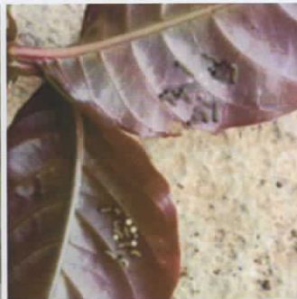
(b) Fase larva instar 1-3