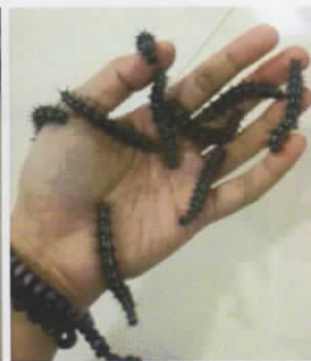
(d) Fase larva instar 5