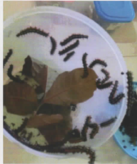
Gambar 6. Ulat daun ungu direaring dengan daun ungu