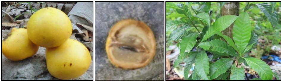
Gambar 4. Buah dan daun sawo mangga ( Pouteria caimito ).