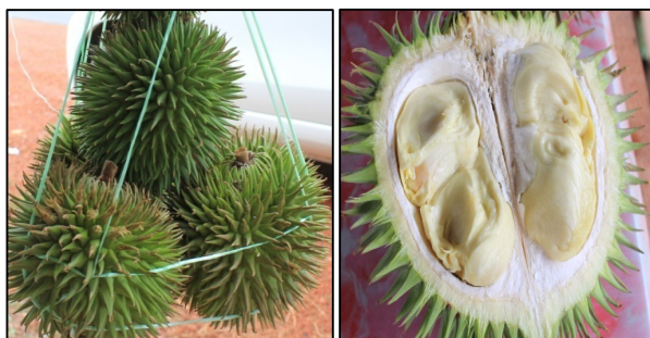
Gambar 6. Buah durian daun ( Durio oxleyanus ).