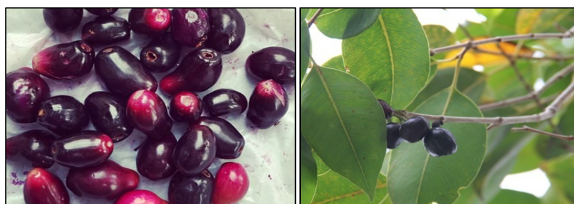
Gambar 7. Buah jamblang ( Syzigium cumini ).

Pada Tabel 3 ditampilkan hasil pengamatan lapang terhadap pemanfaatan buah eksotik di