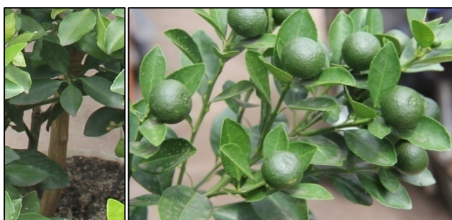
Gambar 3. Tanaman jeruk kunci ( Citrus amblycarpa ).