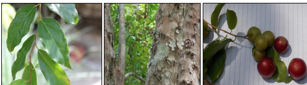
Gambar 1. Daun, batang, dan buah rokam ( Flacourtia rukam ).