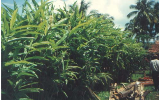
Gambar 4. Alpinia galanga