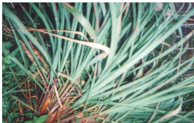
Gambar 3. Cymbopogon nardus