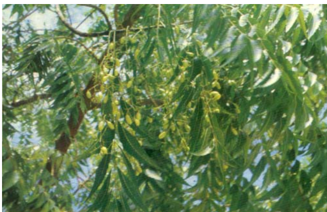
Gambar 2. Azadirachta indica

Untuk 1 ha pertanaman dibutuhkan 8 kg daun A. indica (nimba), 6 kg daun C. nardus (serai wangi) dan 6 kg rimpang Alpinia galanga (laos).