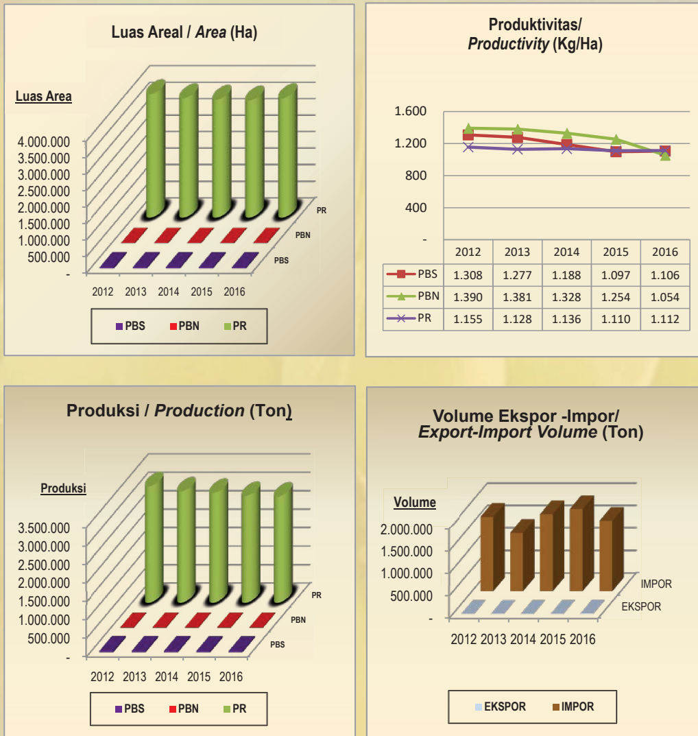
Figure Area, Production, Productivity and Export-Import Volume Trend Graph of Coconut, 2012 - 2016