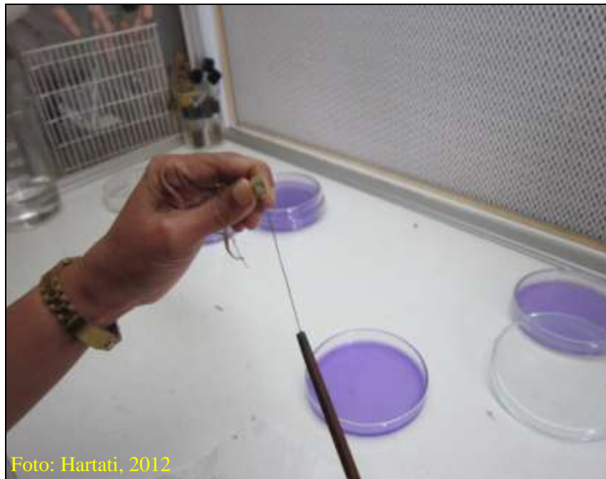
Gambar 15. Pengambilan eksudat R. solanacearum yang keluar dari batang jahe dengan jarum ose