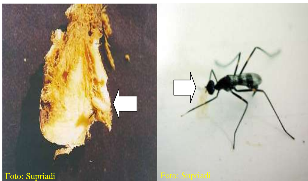
Gambar 9. Lalat dewasa pada rimpang jahe