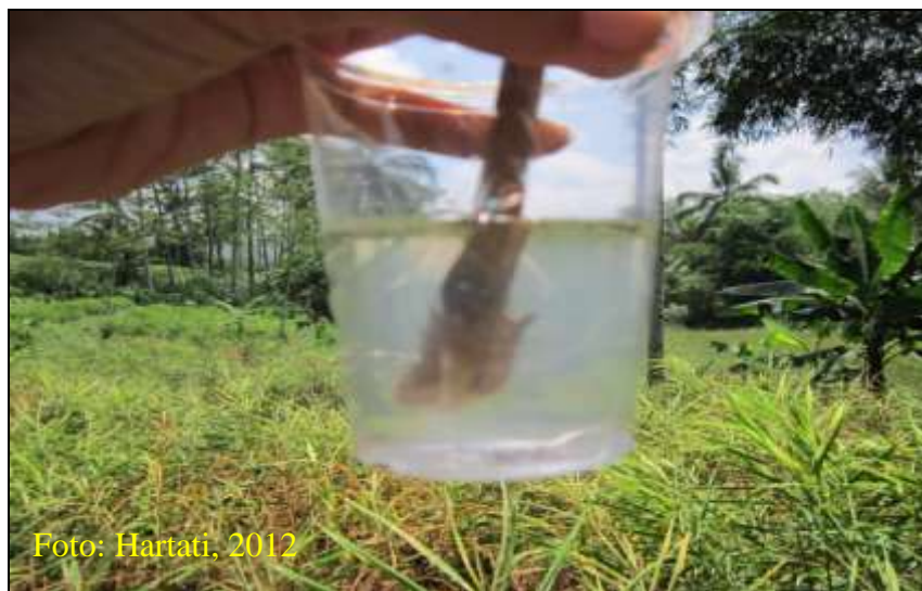
Gambar 13. Eksudat bakteri yang keluar dari batang jahe yang terinfeksi layu bakteri

batang dan air di dalam gelas menjadi keruh menandakan adanya infeksi R. solanacearum (Gambar 13).