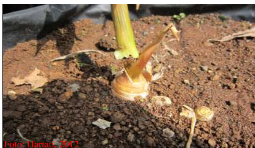
Gambar 2. Batang jahe busuk yang mudah dicabut dari rimpangnya