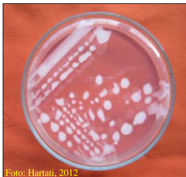
Gambar 10. Isolat R. solanacearum pada media Sukrosa Pepton Agar (SPA)

R. solanacearum merupakan patogen yang mampu bertahan hidup pada akar tanaman yang bukan merupakan inang dan pada tanah dalam jangka waktu yang cukup lama. Kondisi lingkungan sangat mempengaruhi kemampuan bertahan dari R. solanacearum tersebut. Kelembapan tanah yang tinggi dapat meningkatkan populasi bakteri tersebut. Sementara kandungan bahan organik tanah yang tinggi dan kondisi temperatur yang tinggi akan mengurangi populasinya. R. solanacearum mudah berkembang, menular, dan menyebar terutama pada musim hujan, lembap, dan panas. Oleh karena itu penyakit layu bakteri sangat sulit dikendalikan.