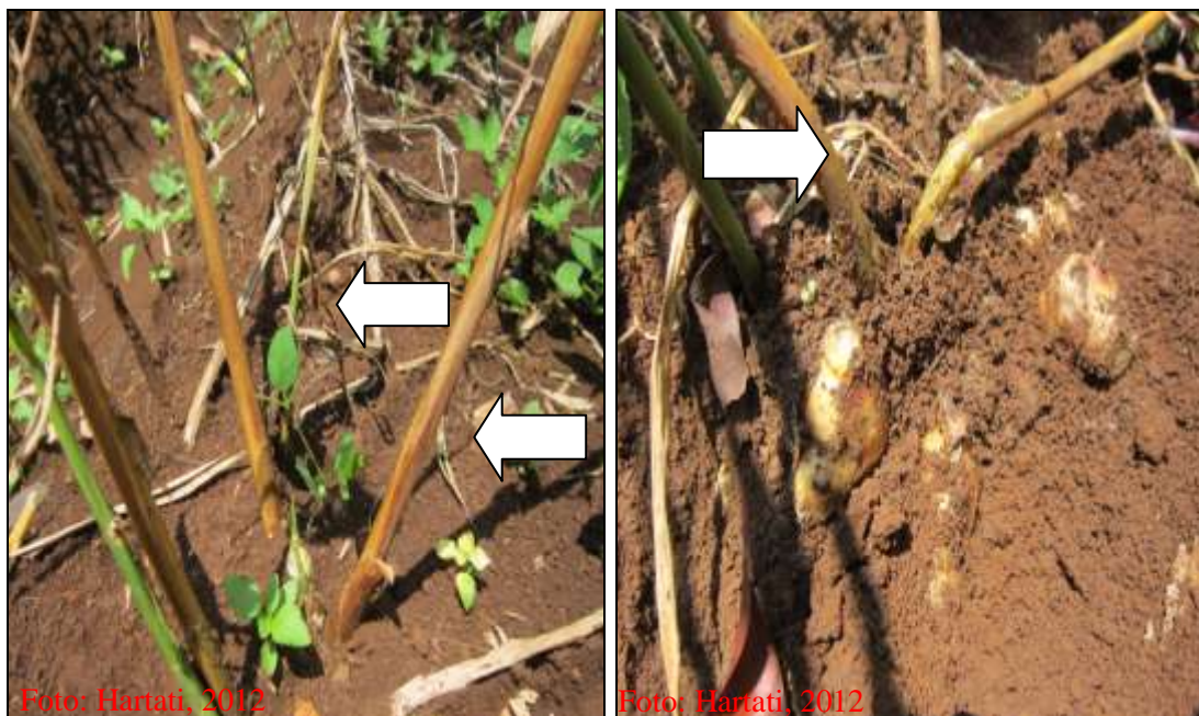
Gambar 3. Gejala busuk basah pada pangkal batang jahe