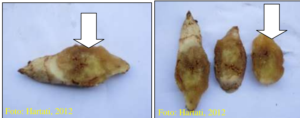
Gambar 11. Gejala busuk pada rimpang jahe akibat penyakit layu bakteri