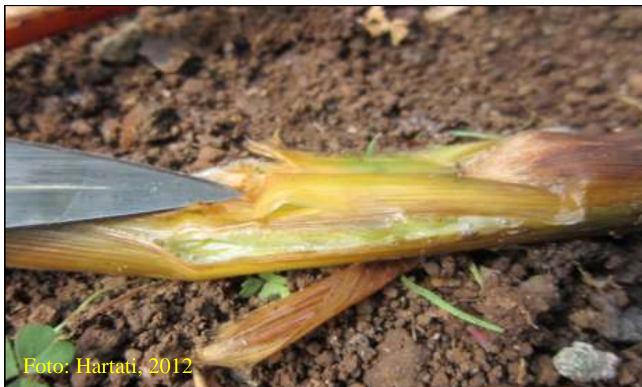
Gambar 12. Eksudat bakteri R. solanacearum