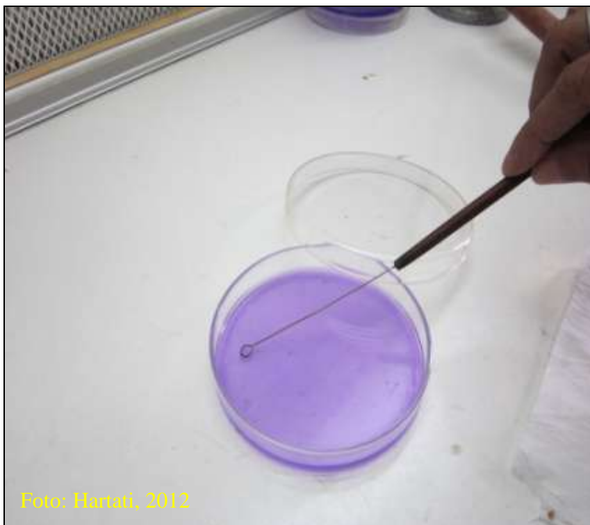
Gambar 16. Isolasi R. solanacearum pada media SPA+ antibiotik