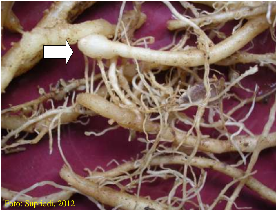
Gambar 5. Gejala serangan nematoda pada akar jahe