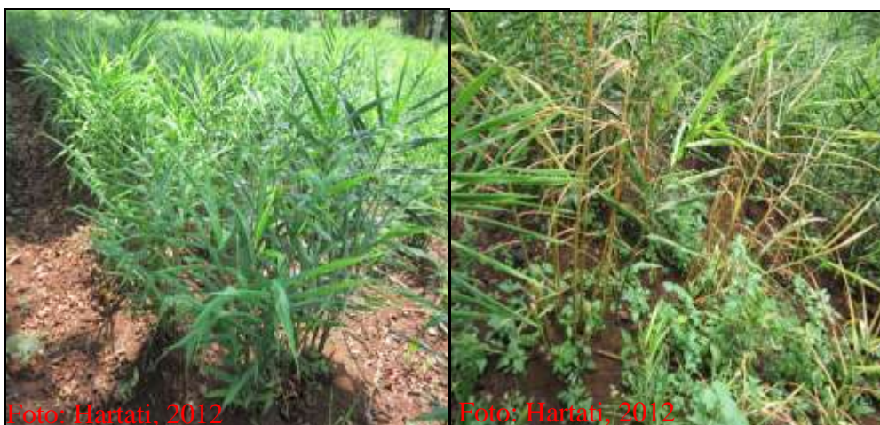
Gambar 1. Tanaman jahe sehat (kiri) dan tanaman jahe terinfeksi layu bakteri (kanan)

Disamping nematoda, lalat rimpang ( Mimegralla coeruleifrons ) juga sering berasosiasi dengan penyakit layu jahe (Jacob, 1980). Bau busuk yang menyengat pada jahe yang terinfeksi akan menarik lalat rimpang untuk datang dan menginfestasi rimpang jahe (Gambar 8 dan 9).