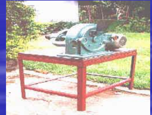
Alsin Pembubuk Kopi