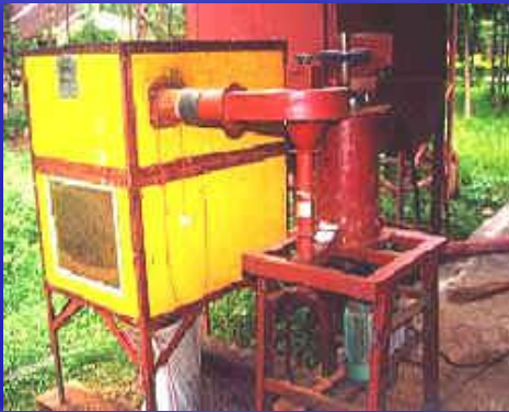
Alsin Pengupas Kulit Kopi