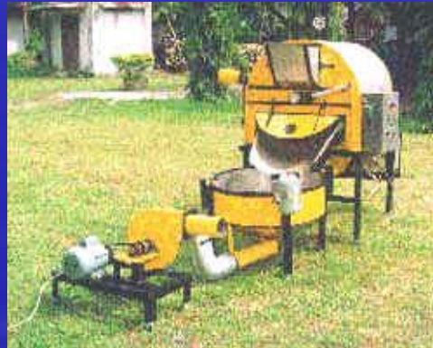
Alsin Penyangrai Biji Kopi