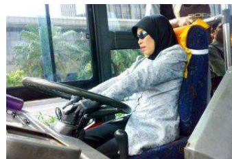
Supir Bus way wanita