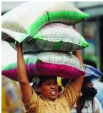
Kuli bangunan wanita