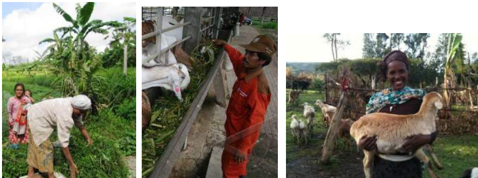
Foto 3. Pencarian dan Penyediaan Pakan Hijauan untuk Kado

*) responden adalah keluarga yang suaminya bekerja secara komuter di luar daerah dan janda.