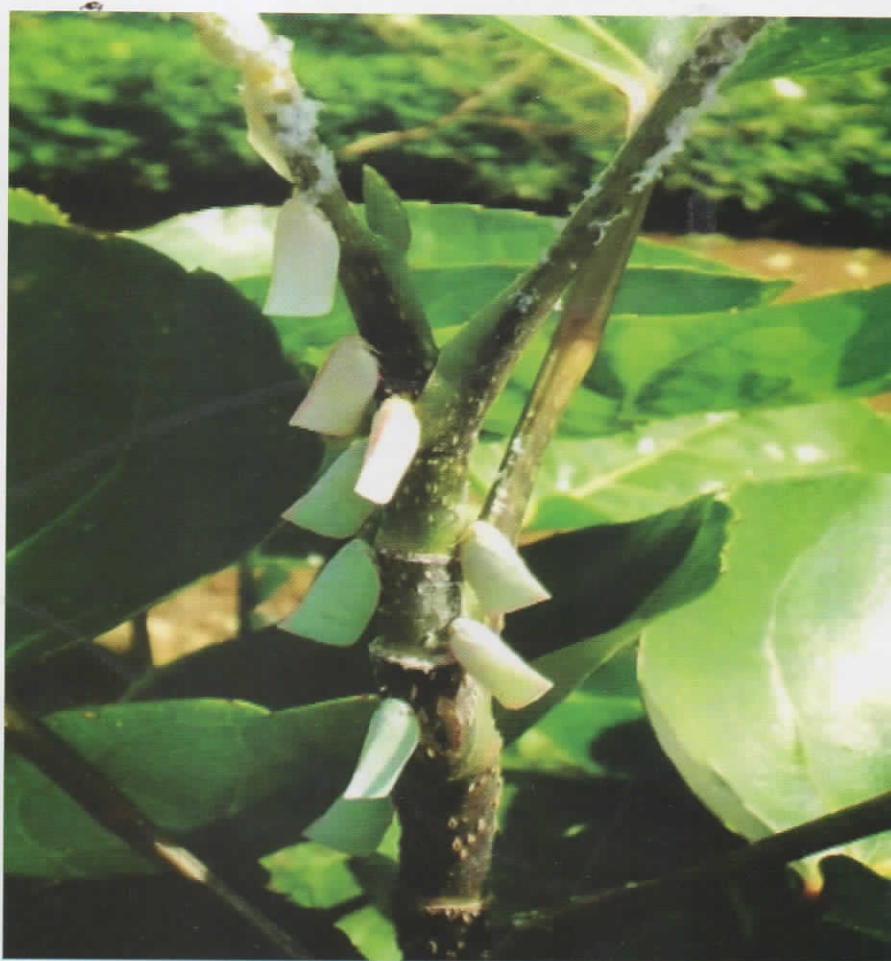
Gambar 1. Sanurus spp. yang menyerang tangkai tanaman mangkokan, S. indecora (putih) dan S. flavovenosus (hijau)

Nimfa dan imago Sanurus spp. menyerang tanaman mangkokan dengan