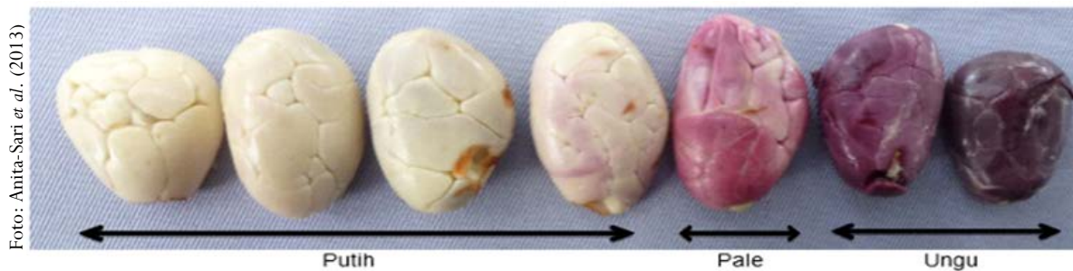
Gambar 1. Warna kotiledon (nib) kakao Figure 1. Colour of cacao cotyledon (nib)

diserbuki, staminodia bunga pada tetua betina perlu dipotong menggunakan pinset yang ujungnya runcing agar mudah melakukan persilangan. Penyerbukan dilakukan dengan cara mengoleskan kotak sari pada kepala putik dan sepanjang tangkai putik.