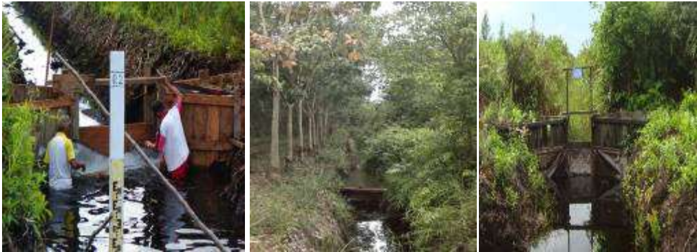
Gambar 5. Sistem tabat di lahan gambut terdegradasi, Jabiren, Kab. Pulang Pisau, Kalimantan Tengah

Rata-rata tinggi tabat dibuat 20 cm dibawah muka tanah, lebar tabat disesuaikan dengan lebar parit yang ada dan jarak antar tabat sekitar 100- 150 m. Dimensi saluran/tabat disesuaikan dengan jenis tanaman yang dibudidayakan (Masganti et al. , 2015). Efektivitas tabat dalam meningkatkan kadar air tanah di lahan gambut cukup signifikan. Hasil penelitian adanya tabat dapat mempertahankan kadar air tanah 80-197% berdasarkan berat kering tanah (Alwi et al. , 2004). Sementara di lahan gambut Kalimantan Tengah tabat dapat mempertahankan kadar air tanah sampai 250%, sedangkan lahan yang tidak ditabat sekitar 60% (Fitrianti et al. , 2017).