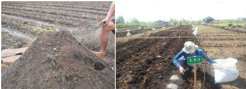
Gambar 7. Penggunaan amelioran untuk memperbaiki kesuburan tanah gambut

Sumber bahan amelioran yang lain berupa tanah mineral yang mengandung banyak sumber kation untuk menekan aktivitas asam-asam organik, sehingga kemasaman tanah menurun. Pemberian tanah mineral akan dapat memperkuat ikatan-ikatan kation dan anion sehingga unsur hara dari pupuk dapat dilindungi dari kehilangan. Dengan adanya ikatan antara koloid mineral dengan bahan gambut menyebabkan degradasi gambut dapat dihambat, sehingga gambut sebagai sumberdaya alam dapat digunakan dalam jangka waktu yang lebih lama. Amelioran yang mengandung kation polivalen (Fe, Al, Cu, dan Zn) seperti terak baja, tanah mineral atau lumpur sungai sangat efektif mengurangi dampak buruk asam fenolat (Sabiham dan Ismangun, 1997; Salampak, 1999; Masganti, 2003). Pemberian tanah mineral sulfat masam dapat menurunkan konsentrasi asam siringat, asam kumarat dan asam vanilat (Hartatik dan Suriadikarta, 2006). Penurunan asam-asam fenolat disebabkan interaksi antara kation Fe dalam tanah mineral sebagai jembatan kation dan asam-asam fenolat melalui proses polimerisasi. Penambahan kation polivalen seperti Fe dan Al akan menciptakan tapak jerapan bagi ion fosfat sehingga bisa mengurangi kehilangan hara P melalui pencucian (Rachim, 1995). Pemberian tanah mineral berkadar besi tinggi dapat meningkatkan pertumbuhan dan produksi tanaman padi (Salampak, 1999).