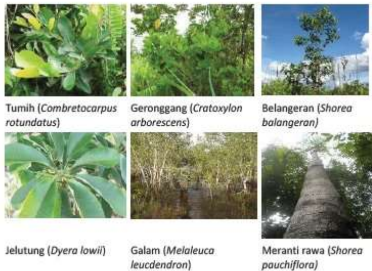
Gambar 3. Jenis tumbuhan yang terdapat di lahan gambut

Salah satu peran lahan gambut adalah sebagai habitat aneka flora dan fauna. Kekayaan flora berupa berbagai jenis pohon yang mempunyai nilai komersial tinggi untuk keperluan bahan industri baik meubel, konstruksi, obat-obatan (farmasi) dan beberapa jenis prespektif lainnya. Beberapa pohon yang dapat dimanfaatkan untuk kayu bangunan antara lain; galam ( Melaleuca leucdendron ), jelutung ( Dyera lowii ), simpur ( Dillenia excels ), bungur ( Lagerstroemia specisa ), pulai rawa ( Alstonia pneumatophora ), tumih ( Combretocarpus rotundatus ), geronggang ( Cratoxylon arborescens ) belangeran ( Shorea balangeran ), meranti bunga ( Shorea teysmanniana ), meranti rawa ( Shorea pauchiflora ), dan terentang ( Camptosperma auriculata ) (Gambar 3).