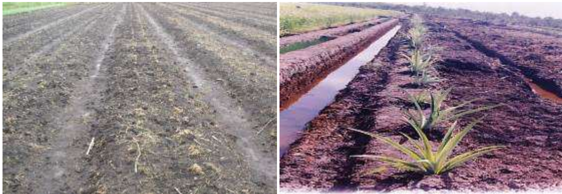
Gambar 6. Model penataan lahan sistem surjan dengan tukang (1) dan guludan (2) di lahan gambut

Penyiapan lahan selanjutnya adalah penataan lahan. Penataan lahan dapat dilakukan dengan membuat surjan untuk lahan yang tergenang, dan sistem tegalan dengan membuat guludan-guludan kecil untuk lahan yang tidak dipengaruhi oleh genangan (Gambar 6). Sistem surjan sudah lama dilakukan petani di lahan rawa yang sering tergenang. Surjan adalah sebuah sistem pertanian di lahan rawa yang memadukan antara sistem sawah dengan sistem tegalan. Penataan lahan sangat tergantung pada kondisi keragaman tipologi lahan dan tipe luapan. Berdasarkan tipologi lahan, luapan pasang surutnya air, dan jenis komoditas yang dikembangkan, maka bentuk atau model surjan dapat dipilah dalam tiga model, yaitu (1) model surjan dengan tambahan tukang, (2) model surjan tanpa tukang, dan (3) model surjan bertahap. Tinggi surjan bervariasi tergantung tinggi genangan di lahan. Pada lahan pasang surut tipologi D, penataan lahan dengan menerapkan sistem tegalan. Sistem tegalan penataan lahan yang dilakukan umumnya hanya membuat guludan yang tingginya berkisar antara 30–40cm (Widjaya Adhi, 1995)