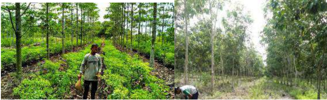
Gambar 8. Sistem agroforestri jelutung + cabai dan karet + nanas di lahan gambut terdegradasi

Jenis tanaman pokok pada sistem agroforestri dapat dipilih jenis MPTS ( Multiple Purpose Tree Species ) seperti sengon ( Paraserianthes falcataria ), jelutung ( Dyera lowii ), pulai ( Alstonia pneumatophora ), sukun ( Artocarpus sp) atau tanaman kehutanan yang lain, dengan tanaman semusim pertanian yang cocok untuk lahan gambut seperti lidah buaya ( Aloe vera ), nanas ( Ananas comusus ), tanaman obat-obatan, dan tanaman pangan lain yang sesuai di lahan gambut.