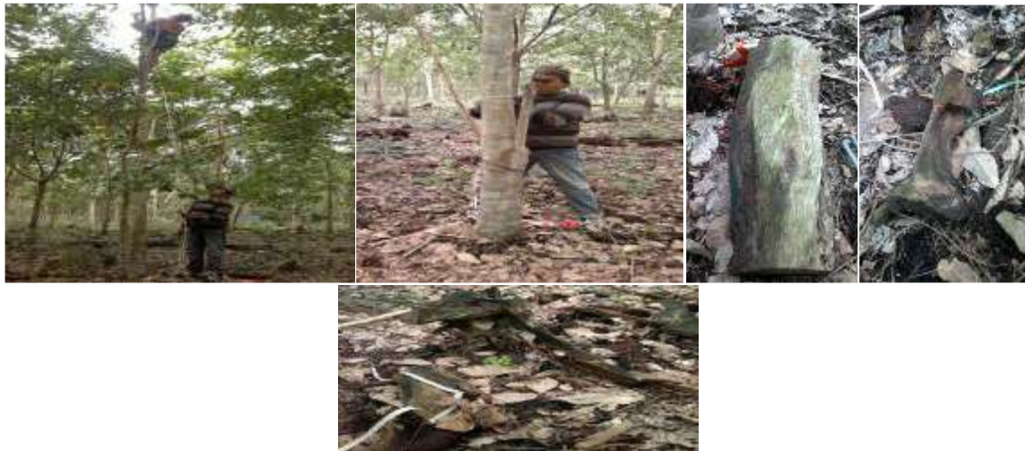
Gambar 2. Potensi cadangan karbon di lahan gambut

Lahan gambut dengan keadaan hutan alami merupakan penyerap ( sink ) CO 2 . Hutan gambut alami, yang tidak terpengaruh drainase dan kemarau panjang, tumbuh secara perlahan dengan kecepatan 0-3 mm/tahun karena adanya batang pohon mati atau ranting yang menumpuk di atasnya dan melapuk secara lambat. Namun apabila hutan gambut dibuka dan didrainase maka lahan gambut berubah fungsi dari penyerap menjadi sumber emisi gas karbon (CO 2 ) yang merupakan salah satu gas rumah kaca (Agus dan Subiksa, 2008).