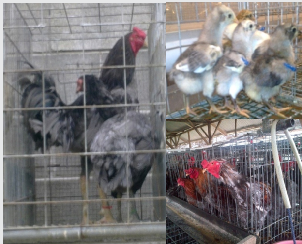
Ayam SenSi-1 Agrinak Abu