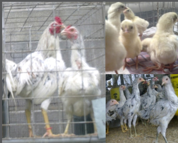
Ayam SenSi-1 Agrinak Pucak