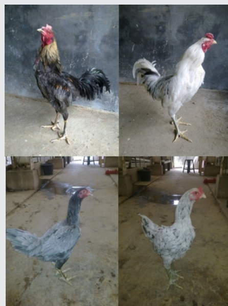
Ayam SenSi-1 Agrinak

Galur ayam SenSi-1 Agrinak dipilih dari ayam ras Sentul Asli yang berasal dari Kabupaten Ciamis, Provinsi Jawa Barat. Setelah melalui seleksi,