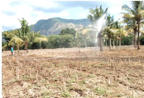
Gambar 7. Teknik irigasi dengan big gun sprinkler

Teknik irigasi springkler dipilih dalam kegiatan ini karena dengan kondisi air yang terbatas seperti di Sumbawa Barat, teknik ini lebih menguntungkan karena lebih menghemat air dibandingkan irigasi permukaan. Keunggulan lain dari sistem irigasi springkler adalah selain digunakan untuk menyiram tanaman, sistem ini juga dapat sekaligus digunakan untuk pemupukan dan pengendalian hama dan penyakit tanaman. Disamping itu sistem irigasi ini dapat menjaga kelembaban tanah dan mengontrol kondisi iklim sesuai pertumbuhan tanaman, termasuk pada lahan marginal yang memiliki kapasitas infiltrasi atau kapasitas menyimpan air yang rendah.