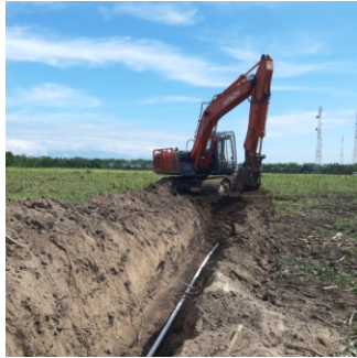
Gambar 5. Penggalian jaringan dan penimbunan pipa dengan excavator