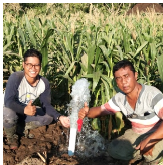
Gambr 6. Pemasangan outlet jaringan irigasi