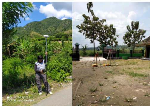
Gambar 3. Kegiatan survei topografi