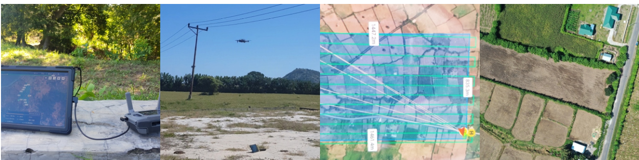
Gambar 1. Kegiatan Survei Foto Udara

Analisis dan desain dilakukan sebagai dasar penentuan spesifikasi pompa, diameter dan panjang pipa yang dibutuhkan serta pilihan teknik penyiraman