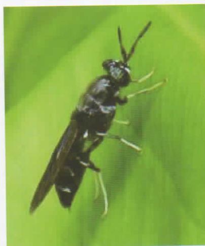
Gambar 1. Hermetia illucens

Lalat tentara hitam dapat ditemui di seluruh dunia, antara 40° LS dan 45° LU dan telah banyak ditemukan di banyak negara di Eropa, Afrika, Oceania (Australia dan Selandia Baru), dan Asia (Indonesia, Jepang, Filipina dan Sri Lanka). Menurut Dortmans et.al (2017) lalat ini berkembang biak dengan baik pada temperatur yang hangat. Suhu optimum untuk proses bertelur pada 27,5°C-37,5°C dan pada kelembapan 30-90%. Suhu lingkungan sebaiknya tidak lebih dari 30°C karena pada suhu di atas 30°C pertumbuhan larva dapat terhambat (Dewantoro dan Efendi, 2018).