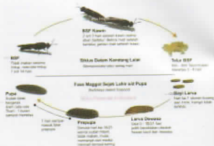
Gambar 3. Siklus hidup lalat tentara hitam

Sekitar tujuh hari fase pre-pupa, larva akan masuk ke fase pupa selama kurang lebih dua hingga 5 hari sampai akhirnya menyelesaikan semua fase metamorfosisnya dan menjadi lalat dewasa (imago). Lalat dewasa tidak makan selama hidupnya dengan rata-rata hidup selama 7-14 hari. Siklus hidup lalat tentara hitam dapat dilihat pada gambar 3.