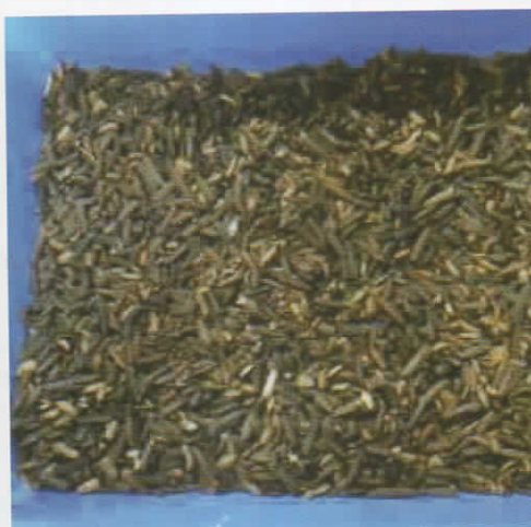
Gambar 2. Larva Hermetia illucens

Tidak seperti lalat pada umumnya (lalat rumah dan lalat hijau) yang hinggap pada makanan, lalat ini tidak hinggap pada makanan dan tidak