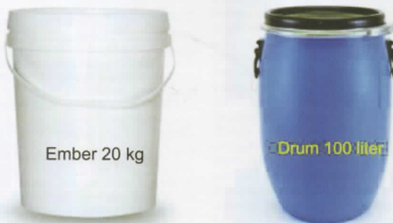
Gambar 4. Komposter sederhana untuk skala rumah tangga.