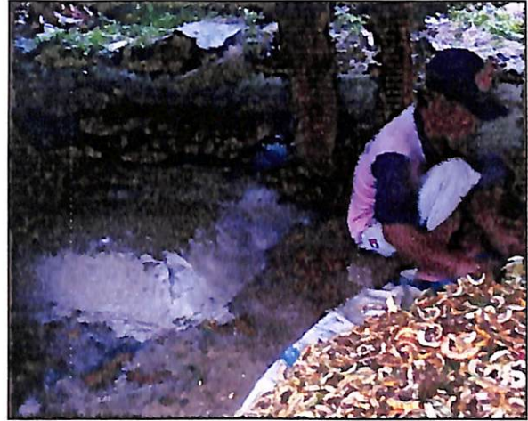
Gambar 11. Pencacahan buah semu jambu mete

Tujuan pencacahan/pencincangan adalah untuk memperkecil bentuk limbah buah semu jambu mete, sehingga lebih mudah untuk difermentasi, dimana fermentasi dapat berjalan lebih sempurna jika permukaan bahan diperluas. Pencacahan dapat dilakukan secara manual dengan pisau atau golok, tetapi agar lebih efisien pencacahan sebaiknya dilakukan dengan alat mesin pencacah. Dimana setelah pencacahan limbah buah semu jambu mete akan berbentuk serpihan-serpihan berukuran 2–5 cm. Sebaiknya proses pencacahan dilakukan segera setelah buah dipanen disaat buah semu jambu mete masih dalam kondisi segar.