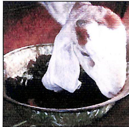
Gambar 9. Pakan konsentrat buah semu jambu mete memberikan pertumbuhan yang positif bagi ternak kambing

Guntoro et al. (2006) menyatakan bahwa pemberian tepung konsentrat tersebut pada ternak kambing kacang mampu meningkatkan berat badan ternak sebanyak 59,65 g/ekor/hari, sedangkan yang hanya diberi pakan hijauan saja hanya 33,58 g/ekor/hari. Begitupun Guntoro (2008) mengemukakan bahwa produksi susu kambing yang diberi pakan hijauan saja relatif sedikit yaitu hanya 180-200 ml/induk/hari, sedangkan yang diberi pakan konsentrat berbahan baku buah semu jambu mete produksinya meningkat menjadi 900 ml/induk/hari.