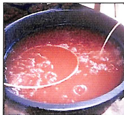
Gambar 12. Larutan fermentasi Aspergillus niger yang sedang di aerasi

⇒ Larutan diaerasi selama 24–36 jam, setelah itu larutan Aspergillus niger dapat dipergunakan. Aerasi dapat dilakukan dengan alat aerator, dimana ujung selang aerator kemudian dimasukkan ke dalam larutan dan diberi pemberat agar tidak mengapung, lalu aerator dihidupkan sehingga timbul gelembung-gelembung oksigen dalam larutan dan larutan menjadi tertekan udara sehingga berputar. Bila di lokasi tidak tersedia listrik dan aerator, larutan dibiarkan selama 72 jam, baru digunakan. Selama proses aktivasi, larutan tersebut diletakkan di tempat yang teduh dan ditutup agar tidak terkontaminasi mikroba lain.