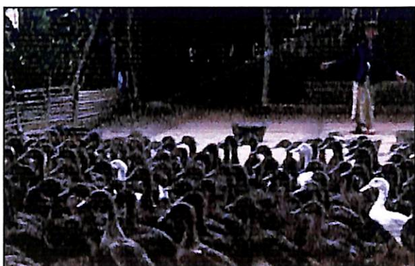
Gambar 3. Ternak itik menyukai pemberian tepung buah semu jambu mete

40% bungkil kacang tanah pada komposisi pakan ikan tersebut.