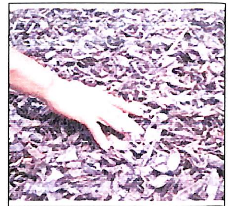
Gambar 15. Pada penjemuran harus dibolak balik agar pengeringan merata