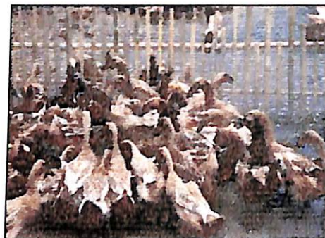
Gambar 7. Pakan konsentrat buah semu jambu mete berdampak positif dalam pertumbuhan ternak itik

Dalam penggunaan untuk ternak ruminansia, tepung konsentrat merupakan pakan penguat, disamping hijauan yang tetap diberikan, dimana pakan penguat sebagai pakan tambahan untuk mempercepat pertumbuhan atau meningkatkan produksi susu. Tepung konsentrat bisa dijadikan pengganti dedak, dengan dosis pemberian 0,7–1,2% dari berat hidup ternak. Pada awal pemberian, sebagian ternak tidak segera mengonsumsi konsentrat buah semu jambu mete dengan lahap. Nampaknya ternak ruminansia memerlukan waktu untuk beradaptasi untuk mengkonsumsinya, oleh karena itu agar ternak lebih berselera mengonsumsi pakan pada tahap awal, tambahkan sedikit garam, gula merah, atau tetes tebu ke dalam tepung konsentrat untuk merangsang nafsu makan. Adapun pada ternak monogastrik, tepung konsentrat buah semu jambu mete bisa dijadikan komponen penyusun ransum sebagai pengganti dedak, dengan dosis penggunaannya bisa mencapai 20–22% dari berat ransum ayam dan hingga 30–35% pada ransum babi (Guntoro, 2008).