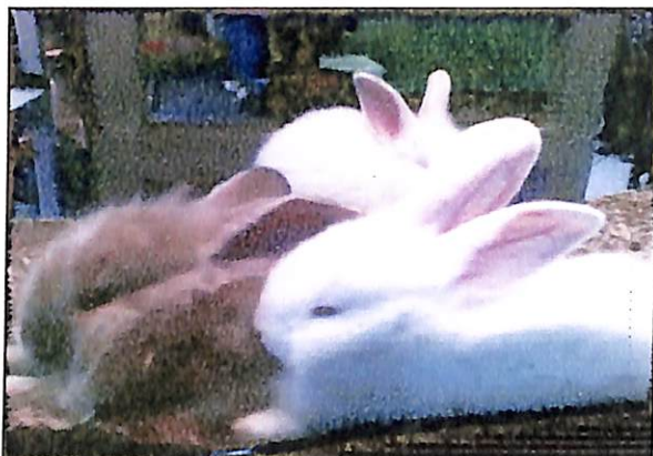
Gambar 10. Pakan konsentrat buah semu jambu mete memberikan pertumbuhan yang positif bagi ternak kelinci

Dengan demikian pakan konsentrat yang dibuat dari limbah buah semu jambu mete melalui proses fermentasi, mempunyai dampak yang positif pada perkembangan dan pertumbuhan ternak ruminansia maupun monogastrik, dimana kualitasnya menyamai kualitas pakan konsentrat komersial yang beredar dipasaran. Menurut Mariyono (2006) pakan yang baik adalah murah, mudah didapat, tidak beracun, disukai ternak, mudah diberikan dan tidak berdampak negatif terhadap produksi, kesehatan ternak dan lingkungan. Dimana pakan konsentrat buah semu jambu mete memenuhi syarat sebagai pakan yang baik.