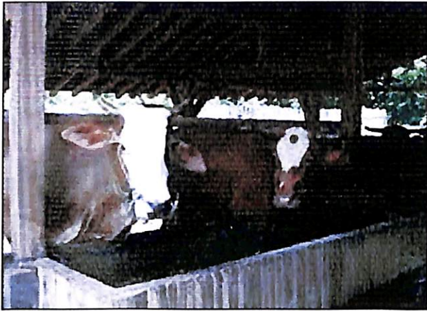
Gambar 8. Pakan konsentrat buah semu jambu mete memberikan pertumbuhan yang positif bagi ternak sapi