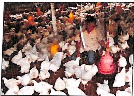
Gambar 6. Pakan konsentrat uah semu jambu mete berdampak positif dalam pertumbuhan anak ayam