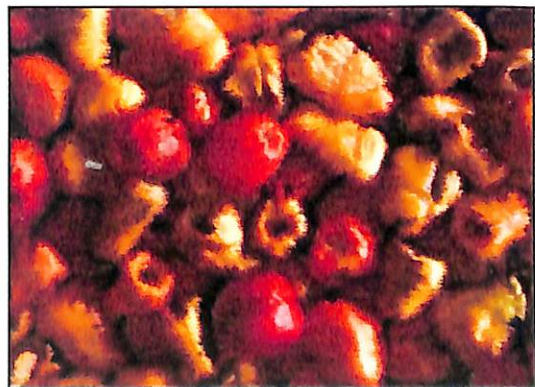
Gambar 1. Buah semu jambu mete

Dengan kandungan air yang banyak, mengakibatkan buah semu jambu mete bersifat juicy , menurut Cormier (2008) dan Smallerab (2011) cairan yang terkandung dalam buah semu jambu mete segar berkisar antara 78-85%. Dimana buah semu jambu mete yang berwarna kuning mengandung lebih banyak cairan sari buah daripada buah semu -