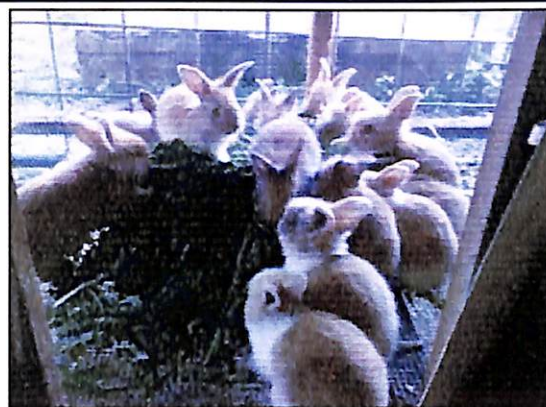
Gambar 2. Pemberian tepung jambu mete terhadap ternak kelinci memberikan pertumbuhan yang positif

Marcel et al. (2011) mengemukakan bahwa substitusi tepung buah semu jambu mete terhadap tepung jagung dan tepung kedelai pada komposisi ransum makanan ternak ayam, kelinci dan babi memberikan pertumbuhan yang positif. Hal tersebut didukung oleh Fanimo et al. (2003) dalam penelitiannya yang mendapatkan bahwa tepung buah semu jambu mete dapat mensubstitusi 20-30% makanan basal untuk ternak kelinci dengan menghasilkan pertumbuhan yang baik.