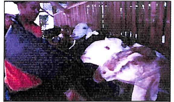
Gambar 5. Ampas buah semu jambu mete dapat diberikan sebagai campuran pada makanan ternak domba

pada ternak, maka dapat dikemas dan disimpan. Disamping diberikan dalam bentuk tepung, buah semu jambu mete dapat juga diberikan pada ternak berupa ampas sisa perasan dari pembuatan sirup, seperti yang dikemukakan oleh Oddoye et al. (2007) dari hasil penelitiannya bahwa pemberian 200 g ampas buah semu mete dalam setiap kg ransum babi memberikan pengaruh yang baik terhadap pertumbuhan babi. Begitupun Sunarso et al. (1983) mendapatkan bahwa sampai dengan level 30% ampas buah semu jambu mete yang dicampur dengan rumput, sangat nyata memberikan peningkatan bobot badan dan koefisien cerna bahan kering dan bahan organik pada ternak domba. Rasa sepat dan gatal nampaknya menurun akibat proses pemerasan sari buah untuk pembuatan sirup, apalagi ampas buah semu jambu mete diberikan dalam komposisi campuran pada makanan ternak tersebut, sehingga rasa sepat dan gatal semakin berkurang.