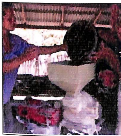
Gambar 16. Penggilingan buah semu jambu mete kering hasil fermentasi

Penggilingan dimaksudkan agar limbah buah semu jambu mete bentuknya lembut seperti tepung sehingga ternak mudah memakan dan mencernanya. Disamping itu, penepungan akan memudahkan dalam penyimpanan, pengangkutan dan pencampuran pada saat diberikan pada ternak. Penggilingan secara efisien bisa dilakukan dengan menggunakan alat mesin penggiling, dimana dalam proses penggilingan ukuran serbuk bisa diatur. Untuk pakan ternak ruminansia, ukurannya bisa agak kasar, sedangkan untuk babi atau unggas sebaiknya bentuknya lebih lembut. Hal ini bisa dilakukan dengan menggunakan saringan dengan ukuran lubang yang berbeda. Adapun untuk alat penggiling berkapasitas 100 kg/jam, diperlukan mesin penggerak berkekuatan 8 HP, sehingga pada proses penggilingan dengan bahan yang banyak akan lebih efisien.