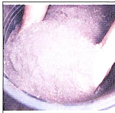
Gambar 17. Tepung konsentrat buah semu jambu mete hasil gilingan