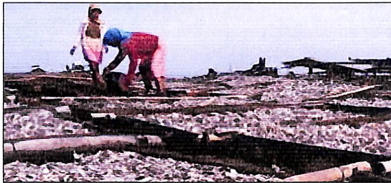
Gambar 14. Penjemuran buah semu jambu mete yang telah difermentasi