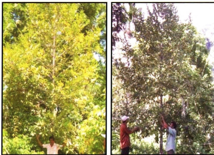
Gambar 3. Penampilan pohon Pala Tidore 1