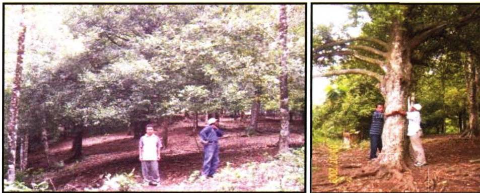
Gambar 2. Penampilan pohon Pala Ternate 1