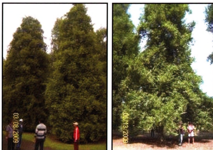
Gambar 4. Penampilan pohon Pala Tobelo 1