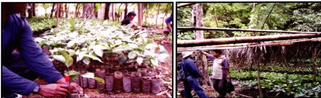
Gambar 6. Pembenihan pala