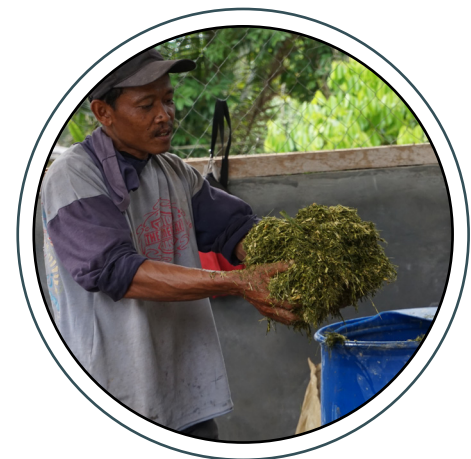
Pengolahan daun dan pelepah untuk silase