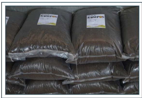
Produk Bioindustri Berbasis Integrasi Sapi – Kelapa Sawit