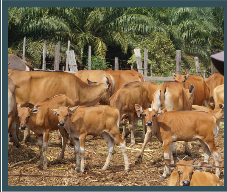
Sapi dikawasan sawit