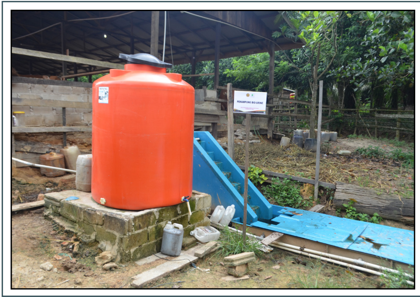
Instalasi Biogas dan Biourine