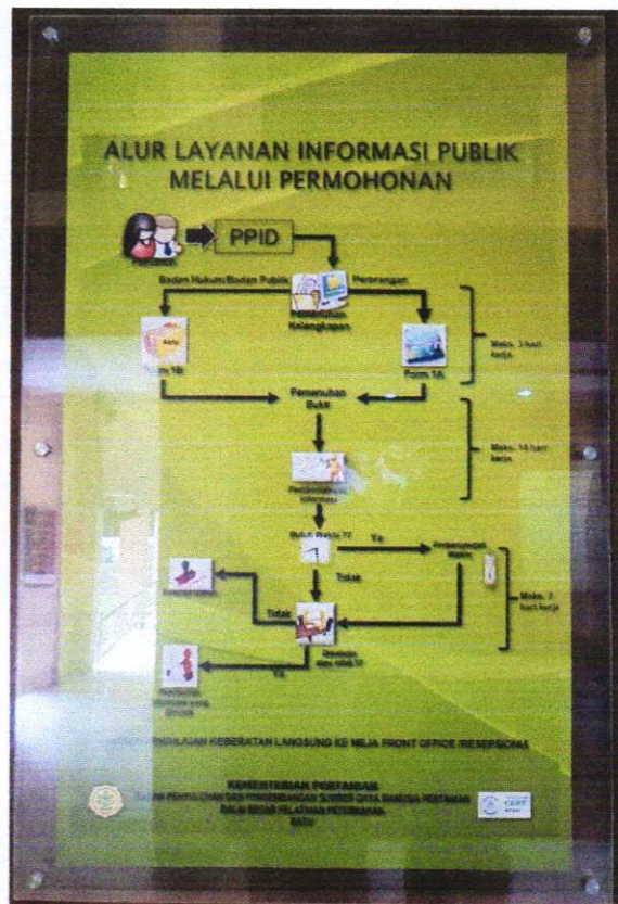
Gambar 2.1 Alur layanan Informasi Publik BBPP Batu