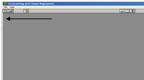
Gambar 1. Tampilan awal program WinQSB