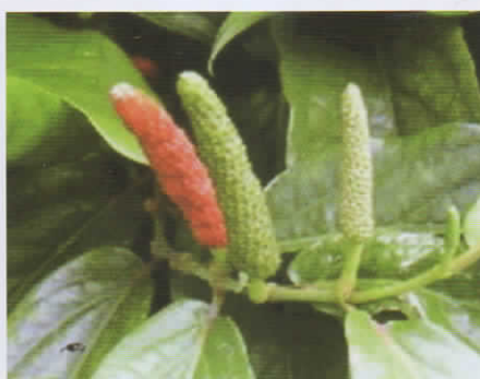
Gambar 1. Cabe jawa segar

Spodoptera litura F., yang dikenal dengan ulat grayak merupakan hama yg sangat merugikan, mempunyai inang