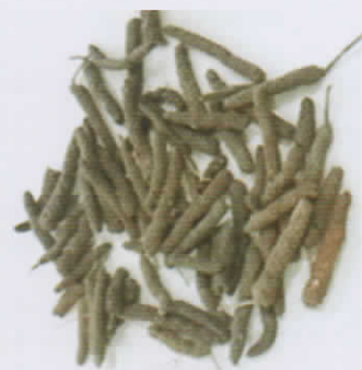
Gambar 2. Cabe jawa kering

Cabe jawa dikeringkan dan di grinder, selanjutnya dimaserasi dengan xylene dan ditambahkan tween 80 sebanyak 1% selama 24 jam. Setelah itu,