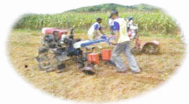
Olah tanah sempurna