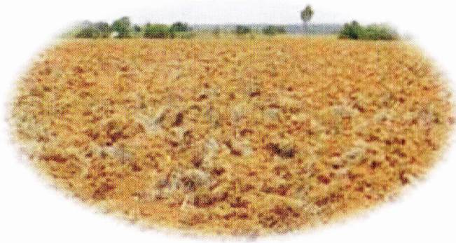
Olah tanah sempurna (OTS) pada lahan kering