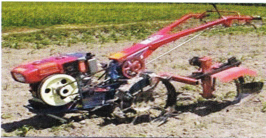
Mesin pembuat alur/drainase, pembumbun, dan penyiang