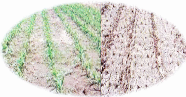
Tanpa olah tanah (TOT) atau olah tanah minimum ada lahan sawah