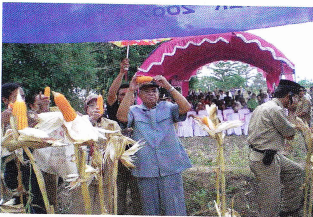
Penanaman varietas unggul baru menjadi salah satu kunci keberhasilan penerapan PTT jagung