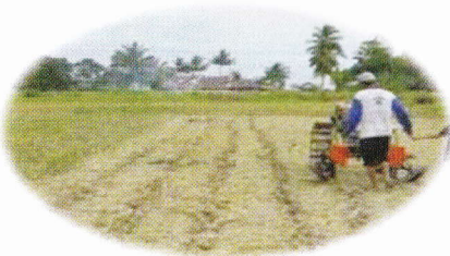
TOT (tanpa olah tanah)