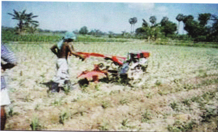
Mesin pembuat alur/drainase, pembumbun dan penyiang