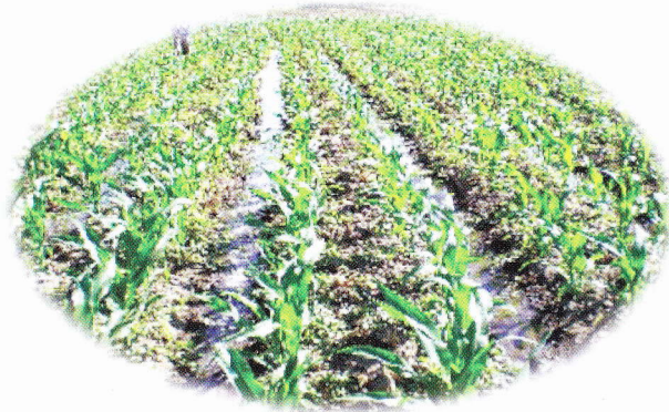
Saluran irigasi yang dibuat untuk setiap dua baris tanaman lebih efisien dibanding setiap baris tanaman