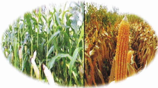
Tanaman jagung dipanen setelah kelobot berwarna coklat dan biji telah mengeras