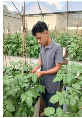
Pengikatan batang tanaman