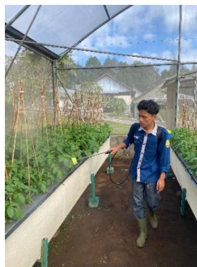
Gambar 6 Penyemprotan pestisida

Langkah awal dalam pengendalian dilakukan melalui pendekatan preventif, seperti menjaga kebersihan lingkungan screen house , melakukan sanitasi alat dan instalasi. Selain itu dilakukan pula Penyemprotan pestisida kegiatan ini merupakan salah satu kegiatan penting dalam budidaya kentang G_0 di screen house BBPP Lembang untuk menjaga tanaman tetap sehat dan terhindar dari serangan hama maupun penyakit. Penyemprotan dilakukan secara berkala, biasanya 1–2 kali dalam seminggu, tergantung pada kondisi tanaman dan tingkat serangan hama/penyakit. Waktu penyemprotan umumnya dilakukan pada pagi hari atau sore hari untuk menghindari penguapan pestisida yang terlalu cepat akibat suhu tinggi.