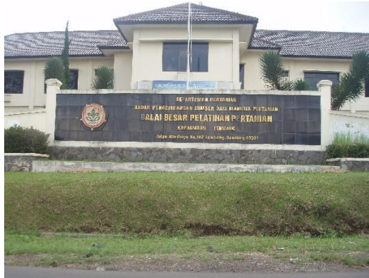
Gambar 1 Kantor BBPP Lembang

Balai Besar Pelatihan Pertanian (BBPP) Lembang berdiri sejak tahun 1962, yang pada awalnya bernama Pusat Latihan Pertanian (PLP) milik Pemda Provinsi Jawa Barat. Kemudian pada tanggal 28 Januari 1978 berdasarkan SK Menteri Pertanian No. 52/Kpts/Orang/1/1978 pengelolaannya diambil alih oleh Badan Pendidikan dan Latihan Penyuluhan Pertanian dan berubah menjadi Balai Latihan Pegawai Pertanian (BLPP) Kayu ambon dengan tingkatan Eselonering IIIB meliputi wilayah kerja Jawa Barat Bagian Timur dan DKI Jakarta.