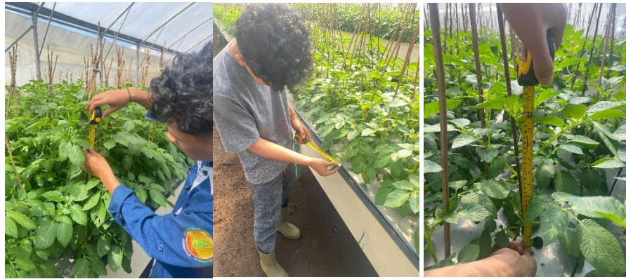
Gambar 8 Pengamatan tanaman

Diameter umbi diukur menggunakan jangka sorong atau pengukur diameter digital. Pengukuran ini dilakukan untuk mengetahui ukuran dan kualitas Umbi yang berdiameter besar menandakan bahwa tanaman mendapatkan nutrisi dan perawatan yang optimal selama masa tumbuh.