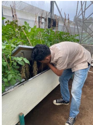
Gambar 4 Pengecekan Nozzle

Nozzle adalah alat kecil yang menyemprotkan larutan nutrisi ke akar tanaman. Karena sangat penting, nozzle harus dicek setiap hari. apakah ada yang tersumbat atau tidak menyemprot. Kalau ada yang mampet, harus dibersihkan. Tujuannya supaya semua akar tanaman mendapat nutrisi secara merata. Jika nozzle tersumbat, tanaman bisa kekurangan nutrisi dan pertumbuhannya terganggu. Hal ini sesuai dengan pendapat Dirjen Hortikultura (2014) yang menyatakan bahwa pemeriksaan noozle dilakukan secara berkala guna mengatasi masalah pada lubang noozle yang tertutup oleh kotoran yang dapat menyebabkan pengabutan tidak lancar.