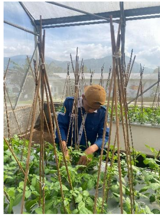
Gambar 3 proses pewiwilan

Kondisi pewiwilan yang tepat membantu mengatur distribusi hormon pertumbuhan dalam tanaman, sehingga menghasilkan pertumbuhan tinggi yang merata dan mendukung perkembangan reproduktif. Perlakuan pewiwilan meningkatkan jumlah tunas lateral, yang berimbas positif pada kualitas dan jumlah benih yang dihasilkan Nabila et al. (2022 )