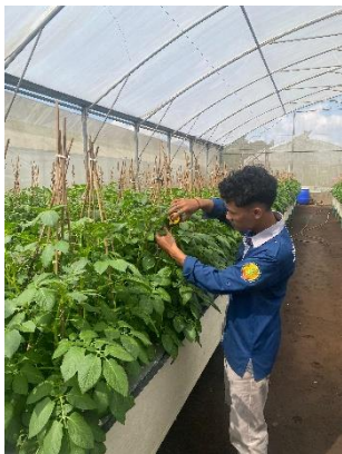
Pengamatan tinggi tanaman