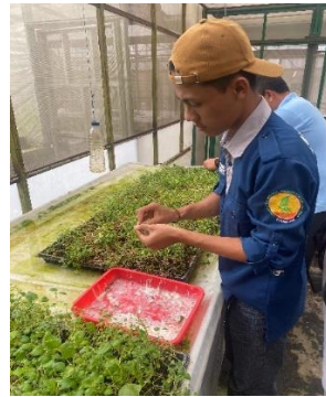
Penyetekan bibit kentang