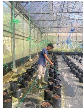
Penyiraman media tanam melon