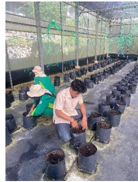
Persiapan media tanam untuk tanaman melon