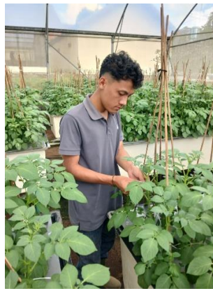
Gambar 5 Proses pengikatan

Tanaman kentang yang mulai tinggi perlu diikat agar tidak roboh atau bengkok. Batangnya diikat dengan tali ke penyangga atau ke tali di atasnya. Ikatannya jangan terlalu kencang agar batang tidak rusak. Pengikatan ini penting supaya tanaman tetap berdiri tegak dan mudah dirawat. Hal ini sesuai dengan pendapat Rostika (2012) yang menyatakan bahwa pengikatan batang bertujuan untuk mencegah tanaman mudah patah dan dapat berdiri dengan tegak di mana pengikatan batang ini dilakukan pada tanaman yang memiliki tinggi 10 cm.