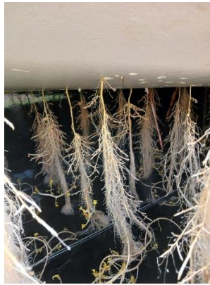
Gambar 9 Perakaran kentang

Salah satu keunggulan dari sistem aeroponik adalah pertumbuhan akar yang sangat cepat dan bebas dari tekanan mekanis media tanam. Akar tanaman kentang yang diamati tampak putih bersih, tidak terserang patogen, dan tumbuh lebat dengan banyak percabangan. Pada pengamatan minggu ke 4 sudah beberapa tanaman sudah mulai menunjukkan adanya stolon atau bakal umbi yang tumbuh dari batang bawah, menandakan bahwa tanaman siap memasuki fase generatif. Ini menunjukkan bahwa transisi dari fase vegetatif ke generatif berjalan dengan baik dan sesuai dengan umur fisiologis tanaman.