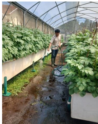
Gambar 2 Penyiraman screen house

Kentang sangat sensitif terhadap suhu yang panas. Jika suhu di screen house terlalu tinggi, tanaman bisa stres dan pertumbuhannya terganggu, selain itu jika suhu screen house panas akan menyebabkan tanaman terkena trips, yaitu tanaman akan berubah warna menjadi coklat. Maka dari itu, dilakukan penyiraman lantai screen house saat cuaca panas, biasanya sekitar jam 10 pagi sampai jam 2 siang. Air disiramkan ke lantai supaya udara menjadi lebih sejuk. Dengan cara ini, suhu udara bisa turun, dan tanaman tetap nyaman.