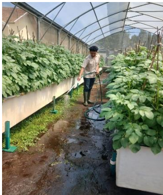
Penyiraman Screen Hose