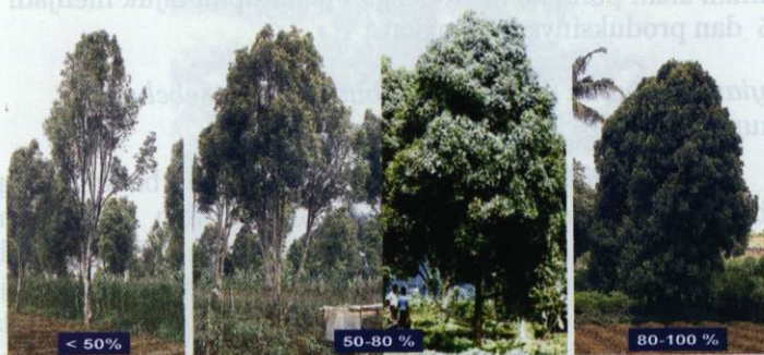
Gambar 2. Kriteria tajuk tanaman cengkeh

Tanaman bertajuk >50% masih dapat dikembalikan produktivitasnya dengan upaya rehabilitasi dan intensifikasi melalui pemeliharaan (penggemburan tanah, pemupukan dan pengendalian OPT). Namun untuk tanaman yang bertajuk <50% dianjurkan untuk diremajakan dengan cara ditebang dan diganti dengan tanaman baru dari tipe cengkeh unggul. Penebangan juga dilakukan terhadap tanaman yang terserang hama dan penyakit yang berat.