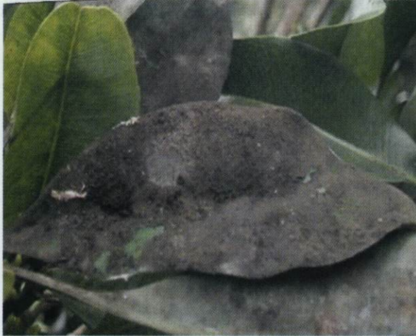
Gambar 11. Tanaman terserang embun jelaga