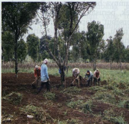
Gambar 5. Peremajaan tanaman cengkeh

Peremajaan tanaman cengkeh ditujukan untuk tanaman yang bertajuk <50% dengan cara ditebang diganti dengan tanaman baru dari varietas cengkeh unggul. Penebangan juga dilakukan terhadap tanaman yang terserang hama dan penyakit yang berat. Dosis pupuk untuk tanaman cengkeh muda dapat dilihat pada Tabel 6.