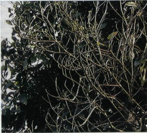
Gambar 9. Tanaman terserang Penyakit Bakteri Pembuluh Kayu Cengkeh (BPKC)

kehilangan hasil mencapai 10-15%. Penyebabnya adalah bakteri Pseudomonas syzygii . Penularan penyakit BPKC dari pohon sakit ke pohon sehat melalui vektor berupa serangga Hindola fulva (di Sumatera) dan H. striata (di Jawa). Pola penyebaran penyakit ini umumnya mengikuti arah angin. Penularan penyakit ini dapat pula melalui alat-alat pertanian seperti golok, gergaji, sabit yang digunakan untuk memotong pohon sakit.