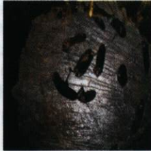
Gambar 7. Penampang melintang batang akibat serangan hama penggerek batang.