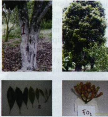
Percabangan pohon, daun, dan bunga cengkeh Zanzibar