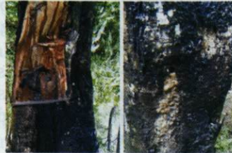
Gambar 8. Serangan hama penggerek pada batang, dari lubang keluar cairan kental.