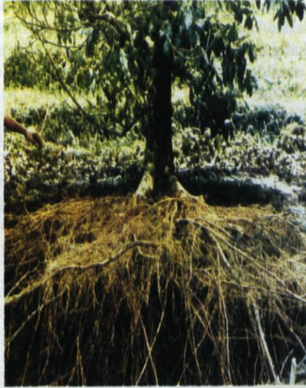
Gambar 3. Penyebaran perakaran cengkeh