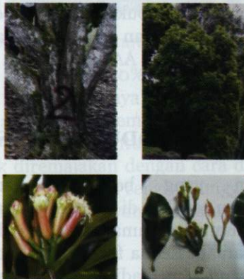
Percabangan, pohon, daun, dan bunga cengkeh Zambon komposit