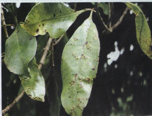
Gambar 10. Tanaman terserang penyakit Cacar Daun Cengkeh (CDC)

Penyakit ini terdapat hampir di semua sentra produksi cengkeh di Indonesia. Penyakit CDC dikategorikan sebagai penyakit utama di samping penyakit BPKC. Penyakit CDC dapat menyerang tanaman cengkeh mulai dari pembibitan sampai tanaman produksi. Berikut ini beberapa jenis penyakit yang sering menyerang tanaman cengkeh dewasa.