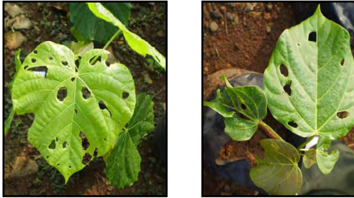
Gambar 1. Daun Benih Kemiri Sunan Terserang Valanga nigricornis