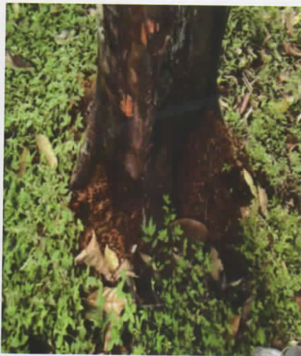
Gambar 1. Tanda serangan hama penggerek batang, serbuk kayu di bawah pohon

Serangga ini termasuk dalam ordo Coleoptera, keluarga Cerambycidae. Menurut Deinum (1948), penggerek batang pala merupakan kumbang besar, dengan antena panjang, aktif malam hari serta tertarik cahaya. Besarnya tingkat serangan ditentukan oleh faktor teknik budi daya dan iklim (Umasangaji et al. , 2012).