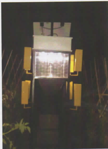
5.b. lampu perangkap energi matahari