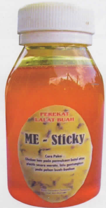
Gambar 7. Lem perangkap