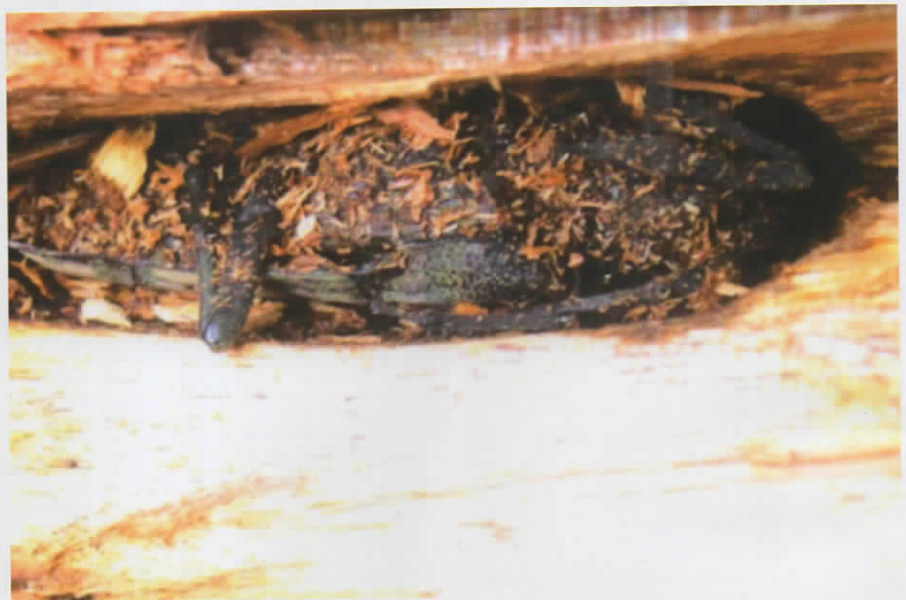
Gambar 6. Kumbang di dalam lubang

Lampu perangkap energi matahari dapat diatur waktu menyala dan matinya secara otomatis. Biasanya lampu menyala menjelang magrib dan mati dengan sendirinya menjelang subuh.