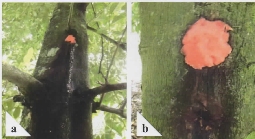
Gambar 4. Lubang aktif (a) dan lubang tidak aktif (b) penggerek batang pala.

Tanda-tanda tanaman pala terserang penggerek adalah adanya serbuk kayu di batang bagian bawah, daun berguguran dan mengering (pada serangan berat) dan adanya lubang pada batang pohon. Lubang aktif dapat diidentifikasi dengan adanya eksudat yang keluar dari lubang (Gambar 4a), sedang lubang tidak aktif tidak ada eksudat yang keluar dari lubang (Gambar 4b).