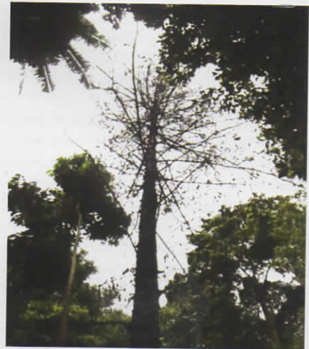
Gambar 2. Pohon terserang penggerek batang.

Kumbang betina bertelur di celah-celah kulit batang dan memasukkan