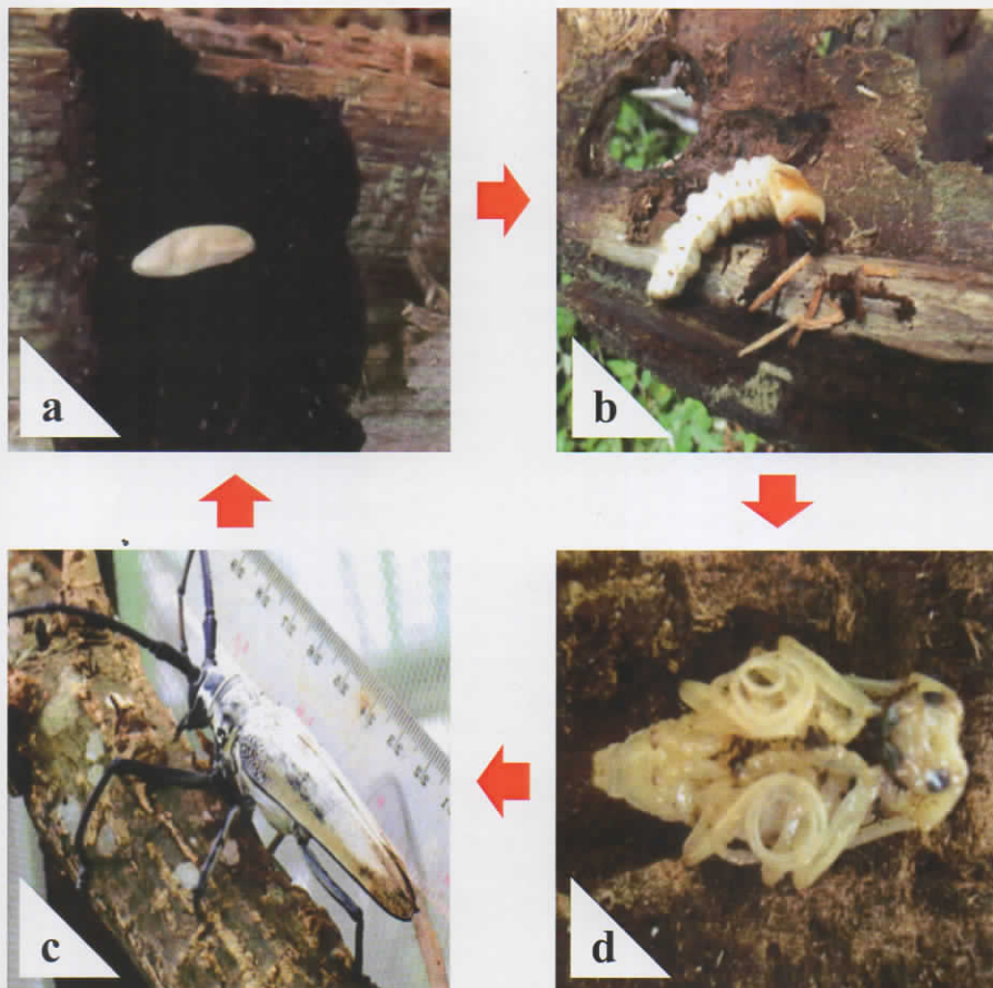
Gambar 3. Telur (a), larva (b), pupa (d), dan imago (c) penggerek batang