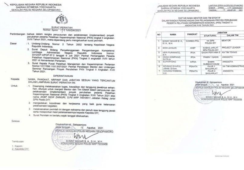
Gambar 3 Surat Penugasan Tim Efektif

Tim efektif yang terdiri dari Tim Teknis dan Tim Administrasi. Keanggotaan tim tersebut dikukuhkan dalam bentuk Surat Penugasan. Gambar berikut merupakan Surat perintah tugas Tim efektif