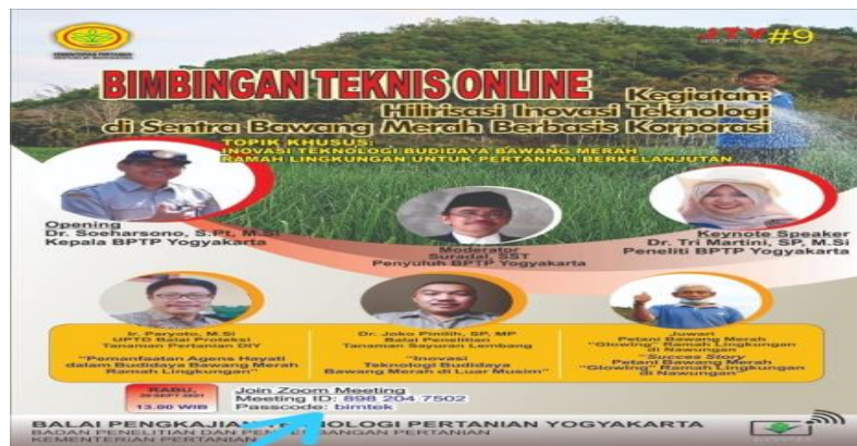
Gambar 16 sosialisasi lewat Pamflet

Berikut gambar lain yang berkaitan dengan pelaksanaan proyek perubahan