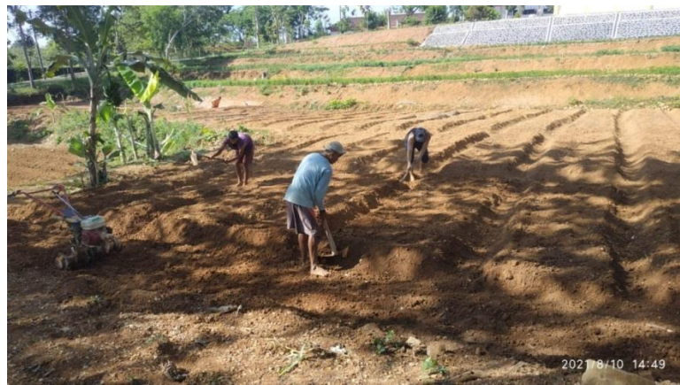
Gambar 19 Penyiapan lahan