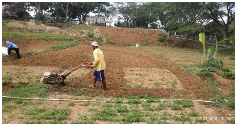
Gambar 5 pembajakan lahan untuk dibuat bedeng

Persiapan lahan dimulai dari pencrin lahan yang memenuhi syarat, pengolahan tanah, pemberian pupuk dasar hingga siap untuk tanam yang dimulai dari tanggal 9 hingga 24 agustus 2021