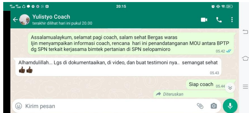
Gambar 2 Bimbingan Peserta dengan coach