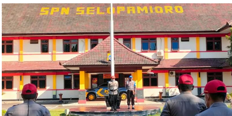
Gambar 15 sosialisasi lewat apel pagi

Berikut gambar sosialisasi yang dilakukan.