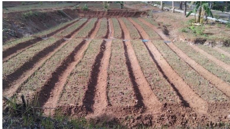
Gambar 20 Masa tanam 1 minggu