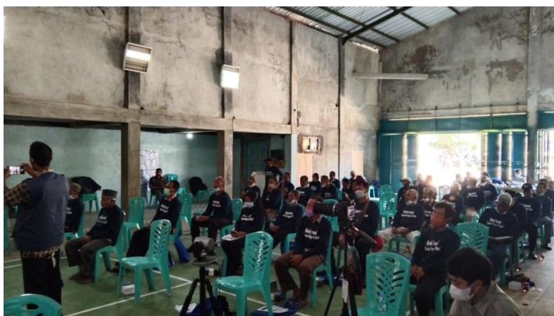
Gambar 7 Bimtek untuk menjaring CPCL enih bawang merah

Bimtek Pertanian untuk menjaring CPCL yang dilaksanakan di Gedung serba Nawungan pada tanggal 1 September 2021 dan Bimtek Online tanggal 29 September 2021