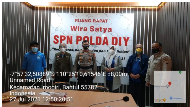
Gambar 17 Koordinasi awal BPTP dengan SPN

Berikut gambar lain yang berkaitan dengan pelaksanaan proyek perubahan