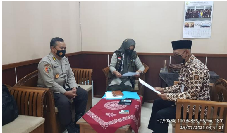
Gambar 18 Koordinasi dg Kadis PKP Bantul