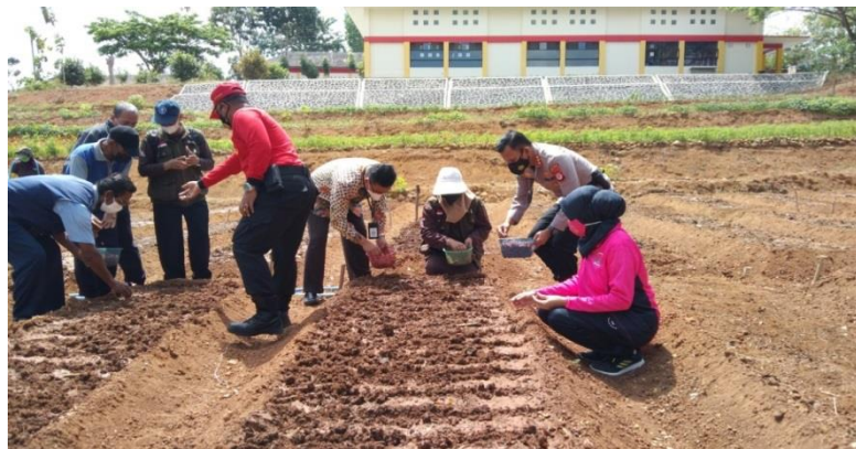
Gambar 13 Penanaman bibit bawang merah varian Bima