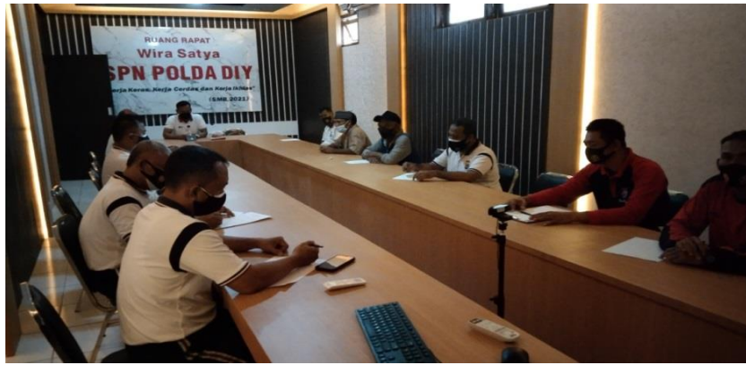
Gambar 4 FGD Tim Penyiapan CPCL dan jenis tanaman uji coba