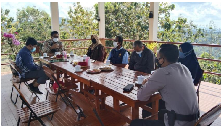
Gambar 6 Persiapan awal meenjelang penandatanganan MOU