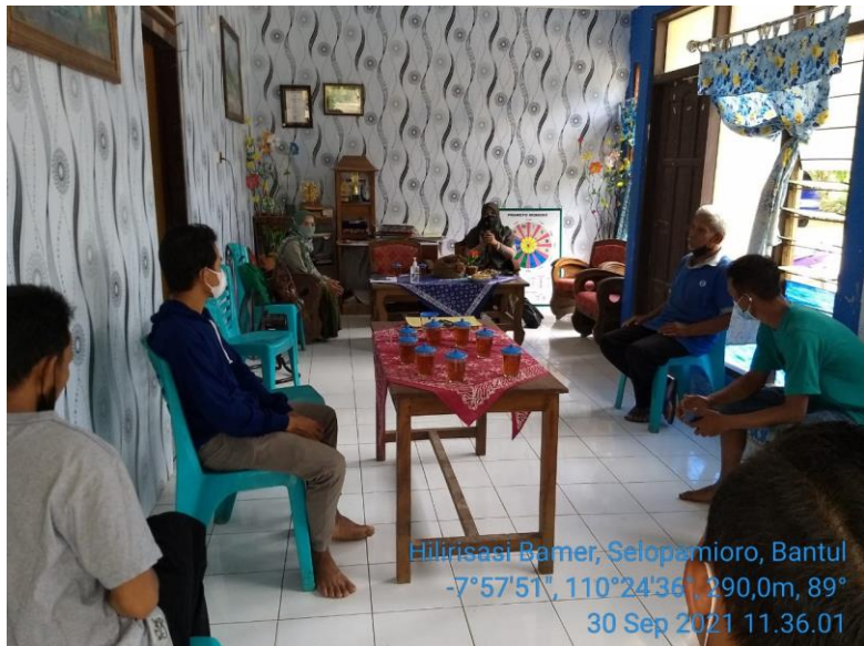
Gambar 22 Dukungan kaum muda CPCL

Berikut akun yang memuat tentang bimtek :