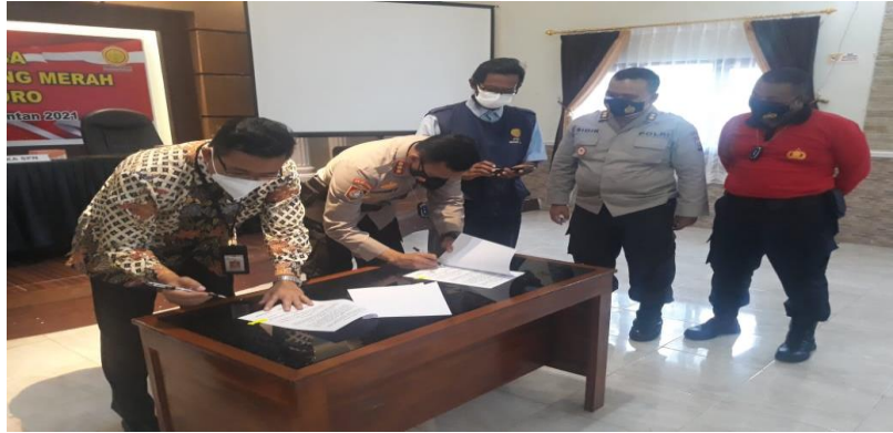
Gambar 10 Penandatanganan MOU antara SPN dan BPTP DIY tentang program Bimtek