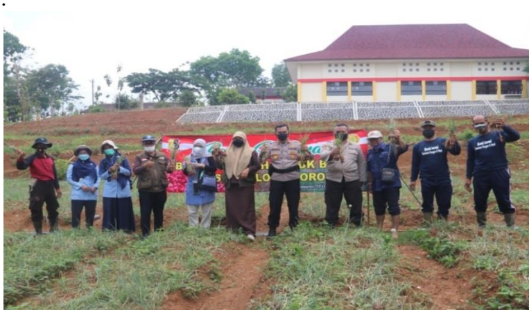
Gambar 14 Panen hasil Bimtek dan pendampingan tanam benih bawang merah