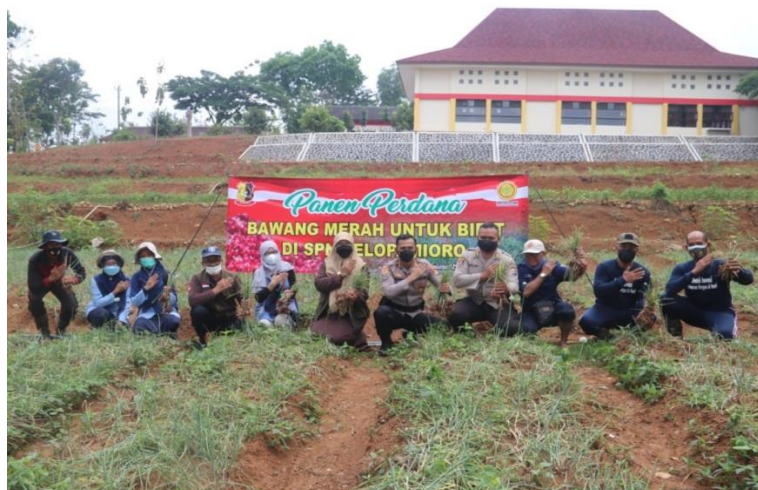
Gambar 9 Panen perdana benih bawang merah