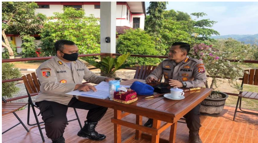
Gambar 1 Kegiatan Bimbingan Peserta dengan Mentor

Pada tahap ini pula diperoleh arahan dan bimbingan dari Coach dan Mentor mulai dari penetapan judul sampai dengan penyusunan laporan Kertas Kerja Proyek Perubahan ini.