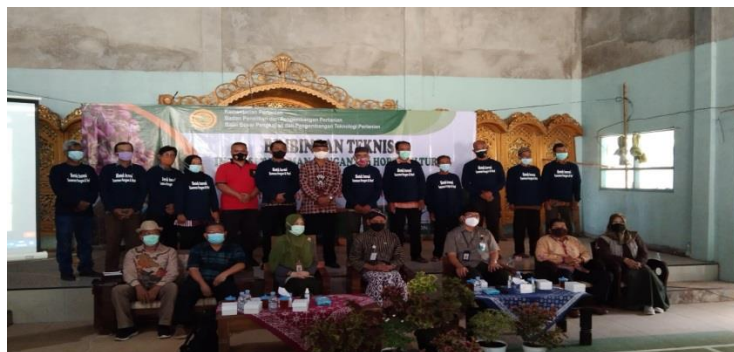
Gambar 11 Bimtek secara offline di Gd Serbaguna/GOR Nawungan