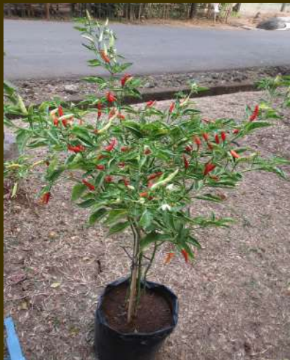
Contoh budidaya cabe dalam polybag

polybag setiap bulannya. Saat memasuki fase generatif yang ditandai dengan munculnya bunga, selain pupuk NPK, dapat ditambahkan pemberian growmore 6-30-30 dengan dosis 2g/l air dan disemprotkan ke bagian tanaman atau disiramkan ke tanah. Aplikasi growmore dilakukan 1 minggu sekali.