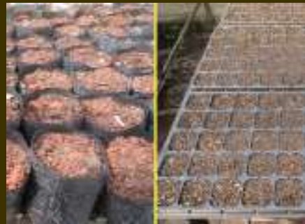
Contoh persemaian di polybag dan tray