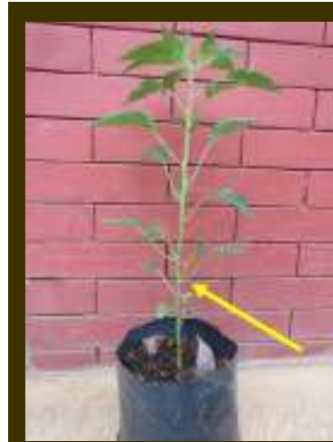
Tunas pada ketiak yang harus dirompes