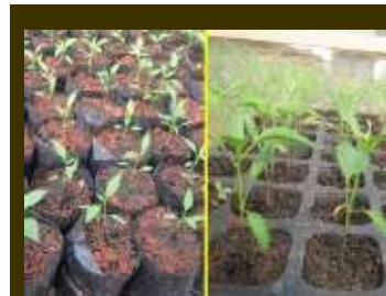
Semaian bibit siap pindah tanam