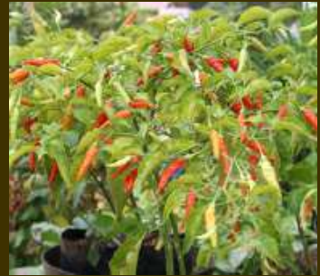
Cabe rawit putih