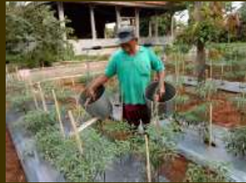
Penyiraman tanaman cabe