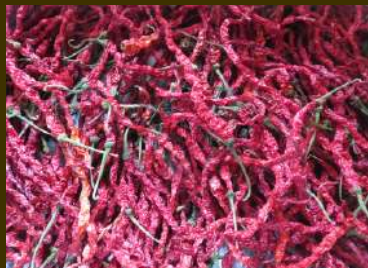
Cabe yang sudah dikeringanginkan 5-6 hari