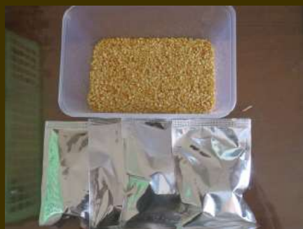
Setelah disortir, benih cabe dikemas dalam aluminium foil