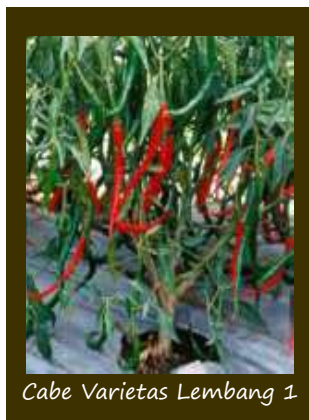
Cabe Varietas Lembang 1

sampai tinggi (lebih baik di dataran medium sampai tinggi)