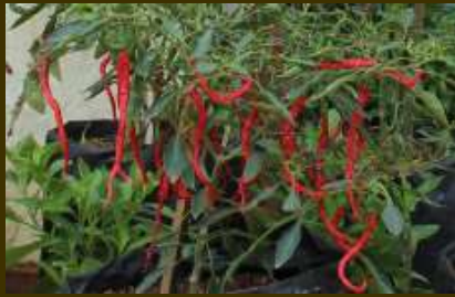
Cabe siap panen