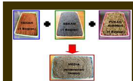
Pembuatan media tanam