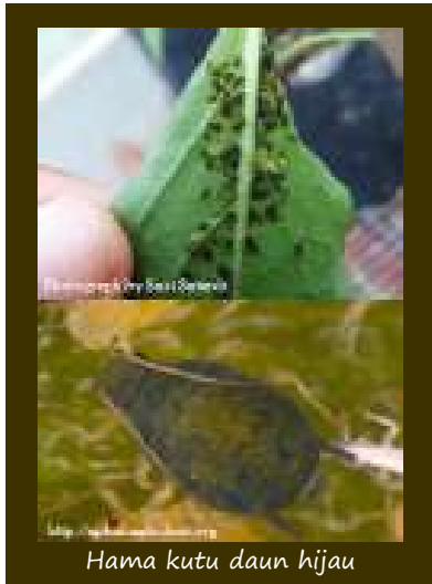
Hama kutu daun hijau

dengan tagetes, pestisida nabati seperti Pyrethrin (dari chrysanthemum ), nimba dan tembakau. Insektisida berbahan aktif Teflubenzuron 50 EC, Permetrin 25 EC, Imidaklorpid 200 SL, dan Metidation 25 WP.