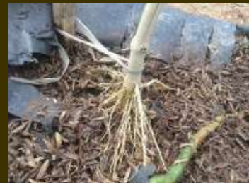
Akar tanaman yang harus dibumbun