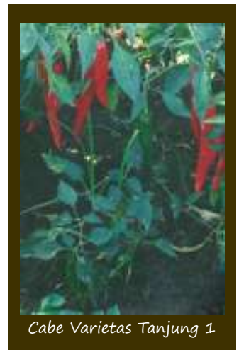
Cabe Varietas Tanjung 1