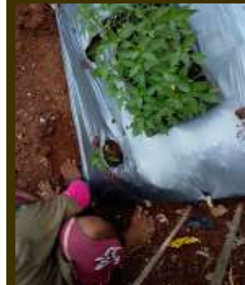
Penanaman di lahan