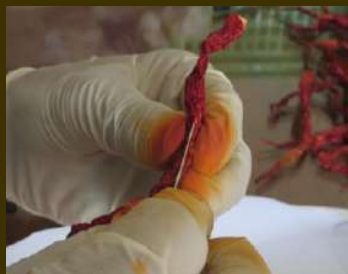
Ekstraksi benih cabe