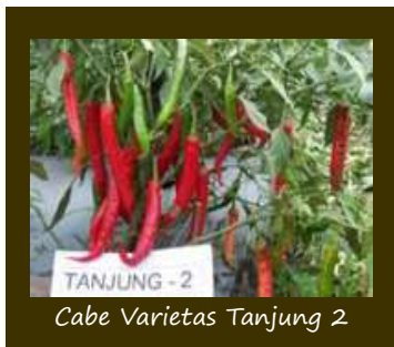
Cabe Varietas Tanjung 2