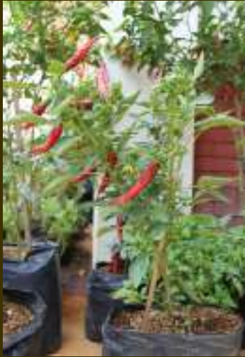
Budidaya cabe besar dalam polybag

Cabe besar berbentuk lonjong panjang dengan ujung melancip. Kulit dan agas buah licin tebal seperti mempunyai lapisan lilin. Cabe besar memiliki diameter buah yang lebih besar dibanding cabe keriting. Pemanenan cabe besar juga dapat dilakukan saat masih berwarna hijau atau saat sudah masak dan berwarna merah. Cabe besar banyak dimanfaatkan untuk bumbu atau menghias hasil masakan.