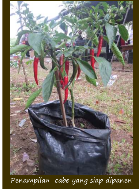
Penampilan cabe yang siap dipanen