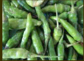
Cabe rawit hijau

Cabe rawit bisa berbuah sepanjang tahun tanpa mengenal musim. Tanaman cabai rawit cukup tahan terhadap segala cuaca dan dapat beradaptasi dengan baik di dataran tinggi maupun rendah. Kebanyakan jenis cabe rawit yang ditanam di Indonesia merupakan varietas lokal. Selain benih komersil, benih yang digunakan banyak yang diproduksi sendiri oleh para petani dari hasil panen sebelumnya.