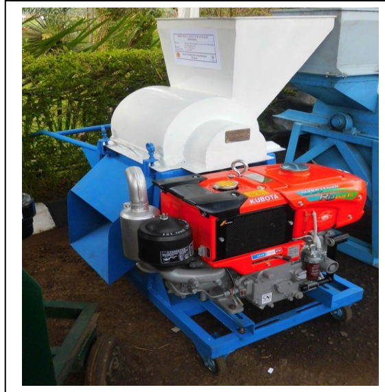
Gambar Modifikasi mesin pencacah kulit kakao segar

Komponen roda pada bagian mesin ini berfungsi untuk memudahkan operator pada saat memindahkan ke lokasi lainnya, sehingga tidak memberatkan dalam mengoperasikan mesin tersebut.