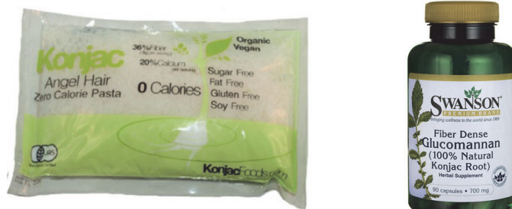
Gambar 4. Suplemen glukomannan berupa pasta dan kapsul Figure 4. Glucomannan as supplement in pasta and capsules.

pengisi dan pengikat (Zuhriatika, 2015; Sari & Widjarnako, 2015).