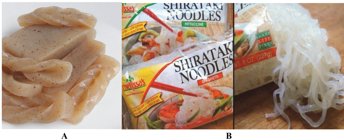
Gambar 3. A. Konjaku dan B. Shirataki Figure 3. A. Konjaku and B Shirataki.

merupakan salah satu bahan untuk pembuatan makanan khas Jepang yaitu “Sukiyaki” yang sudah populer di berbagai negara. Konjaku merupakan makanan sehat yang tidak mengandung lemak, kaya akan serat dan mineral, serta rendah kalori mengingat dalam 100 g glukomannan hanya mengandung 3 Kkal. Beberapa penelitian mendapatkan bahwa konjaku bermanfaat dalam menormalisasi level kolesterol, mencegah tekanan darah tinggi, dan menormalisasi kadar gula dalam darah sehingga dapat mencegah diabetes. Untuk orang yang mengalami obesitas, dapat berperan sebagai dietary fiber , sehingga konjaku cocok sebagai makanan dalam diet (Jin et al. , 2015; Shah et al. , 2015).