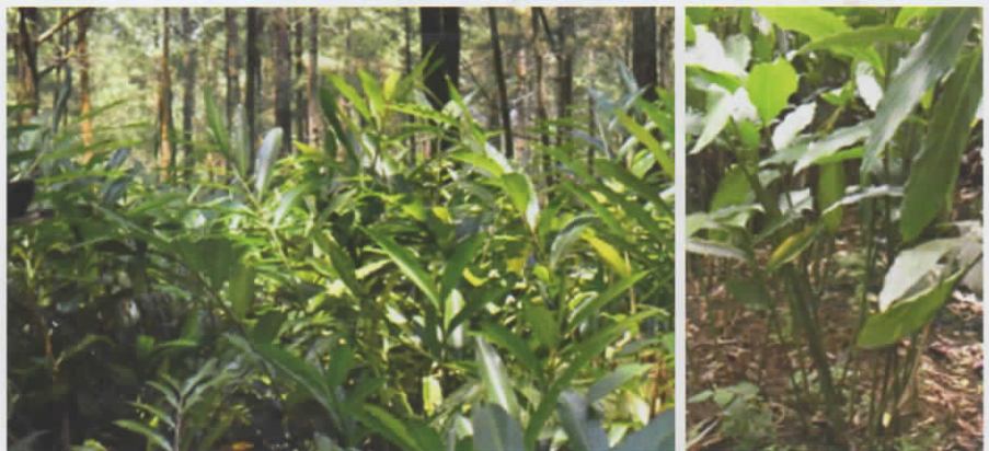
Gambar 1. Penampilan tanaman kapulaga lokal

Kapulaga dapat tumbuh dengan optimal pada ketinggian 300-1000 m dpl. Beberapa sentra produksi kapulaga di Indonesia diantaranya di Jawa Barat, Jawa Tengah, Sumatera Barat dan Banten. Tanaman kapulaga tumbuh sebagai tanaman perdu, yang membutuhkan pohon pelindung untuk tumbuh optimal. Tinggi tanaman kapulaga sekitar 1,5 meter, berbatang semu, buahnya berbentuk bulat dan anakan berwarna hijau (Gambar 1). Tanaman kapulaga memiliki daun tunggal yang tersebar, berbentuk lanset, ujungnya runcing dengan tepian yang rata. Pangkal daun berbentuk runcing dengan panjang 25-35 cm dan lebar 10-12 cm, pertulangan daun menyirip dan berwarna hijau. Batang kapulaga disebut batang semu, karena terbungkus oleh pelepah daun yang berwarna hijau, bentuk batang bulat, tumbuh tegak dengan tinggi sekitar 1-3 m. Batang tumbuh dari rizhome yang berada di bawah permukaan tanah, satu rumpun bisa mencapai 20-30 batang semu, batang tua akan mati dan diganti oleh batang muda yang tumbuh dari rizoma lain.