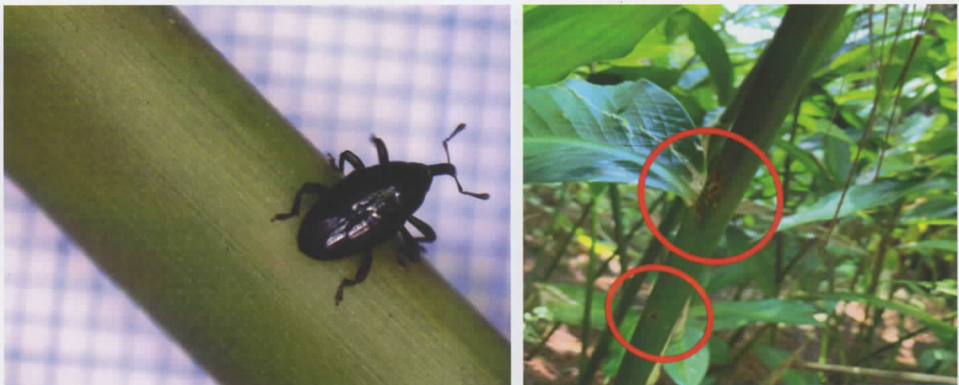
Gambar 5. Kumbang moncong Baris sp. (kiri) dan gejala serangan kumbang moncong Baris sp. pada batang tanaman kapulaga (kanan)