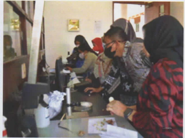
Gambar 2. Kegiatan Surveillance: Surveillance hama di pertanaman kapulaga (kiri); Identifikasi hama yang diperoleh dari lapangan di laboratorium Pengamatan dan Peramalan Hama dan Penyakit Tanaman Pangan Banyumas.