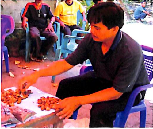
Gambar 3. Sortir benih biji mete