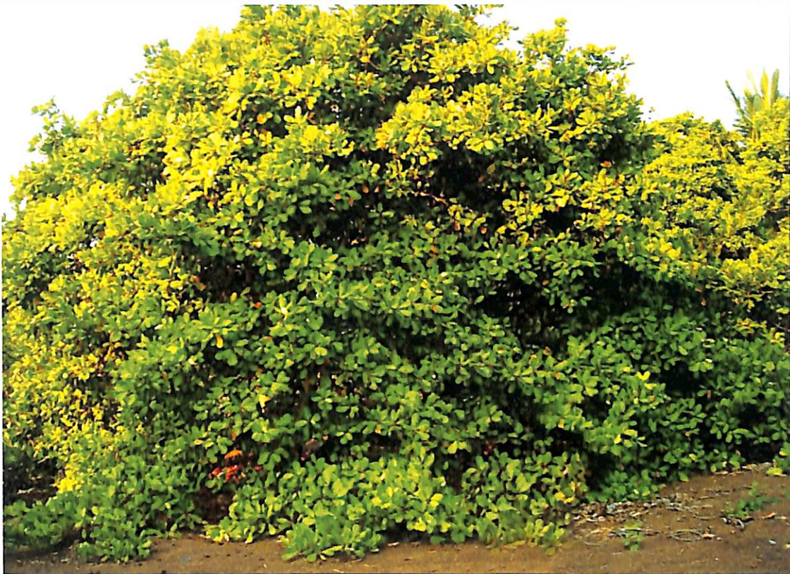
Gambar 1. Pohon Induk Jambu Mete