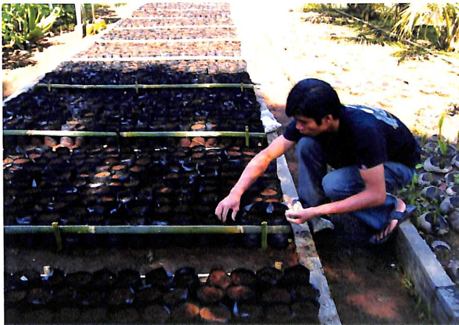
Gambar 5. Penanaman dalam polibag

Benih mete dapat langsung ditanam di areal kebun, dengan cara sebagai berikut: dibuat lubang tanam dengan ukuran 50 x 50 x 50cm, kemudian masukkan tanah yang sudah tercampur dengan pupuk kandang yang sudah matang. Lalu masukkan Benih mete yang vigornya tinggi (80%) sebanyak 2-3 biji/lubang tanam dengan jarak sekitar 10 cm. Sebelumnya lubang tanam tersebut bisa ditaburi Furadan untuk mencegah serangan hama dan penyakit. Setelah tumbuh, pilih 1 tanaman yang pertumbuhannya terbaik. Jarak tanam antara lubang tanam bisa 8 x 8m, 9 x 9 m, 10 x 10 m atau 5 x 5m. Setelah tanam, tanah disiram secukupnya agar tidak kering.