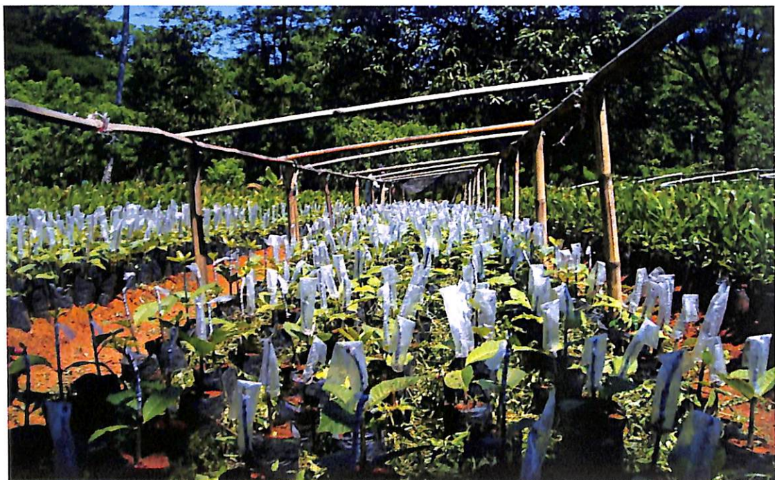
Gambar 8. Hasil sambung jambu mete