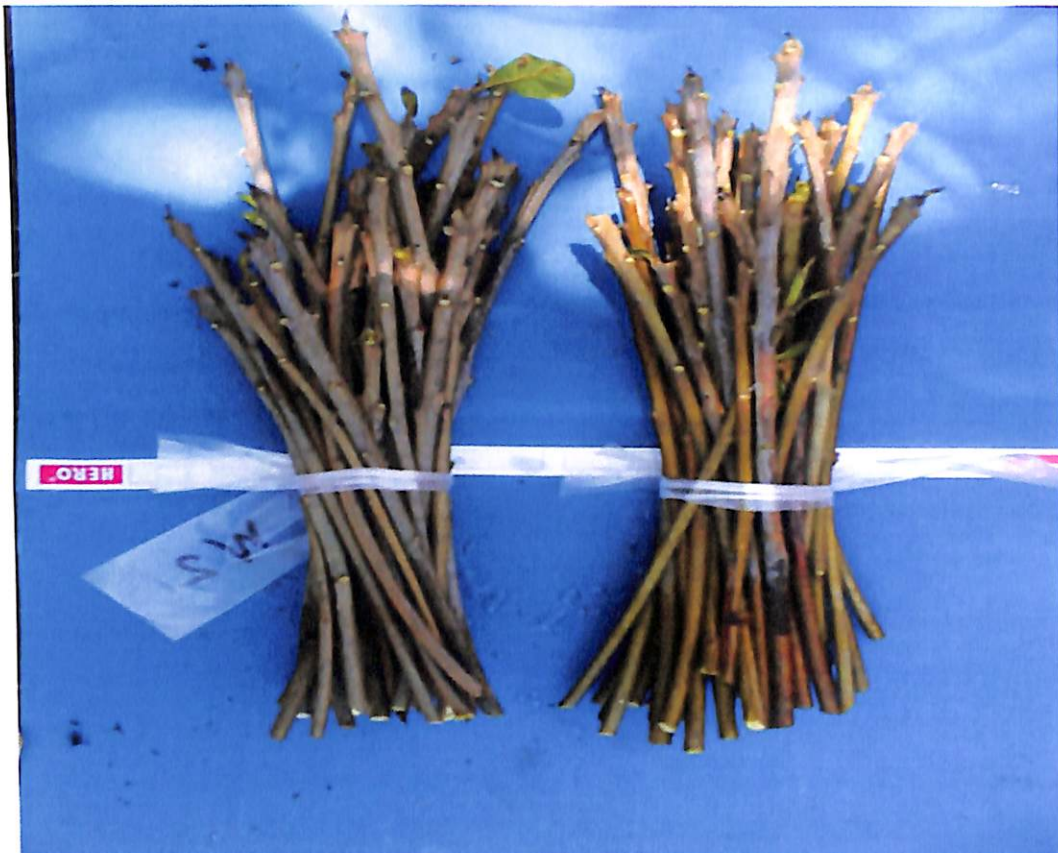
Gambar 7. Batang atas