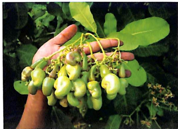
Gambar 2. Bunga dan buah mete produksi tinggi