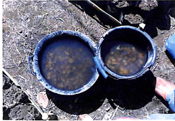
Gambar 4. Benih direndam selama 24 jam