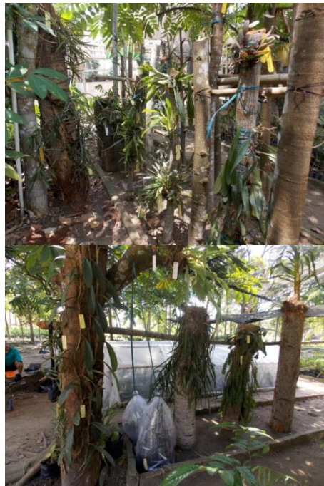
Gambar 4. Hasil penanaman koleksi anggrek di pembibitan sementara Kebun Raya Pelalawan

Jenis-jenis anggrek yang diperoleh dikoleksi dan dikonservasi di Kebun Raya Pelalawan, Riau (Gambar 4). Pulau Sumatera merupakan pulau terbesar di Indonesia, kondisi alam dan iklimnya merupakan tempat yang cocok bagi pertumbuhan anggrek. Ada sekitar 1.118 jenis anggrek yang telah diketahui dan diberi nama dari pulau ini. Masih ada setidaknya sejumlah 10% yang menunggu untuk ditemukan (Comber, 2001). Kebun Raya Pelalawan yang berada di Pulau Sumatera, memiliki peran yang penting untuk melakukan konservasi jenis-jenis anggrek Sumatera terutama yang berasal dari dataran rendah dalam bentuk koleksi tematik jenis-jenis Anggrek Sumatera. Jenis-jenis anggrek yang berhasil dikoleksi baru sebagian kecil dari jenis yang direkomendasikan untuk dijadikan koleksi Kebun Raya Pelalawan yang telah direkomendasikan di dalam masterplan Kebun Raya Pelalawan sebanyak 232 jenis (Witono et al. 2014).