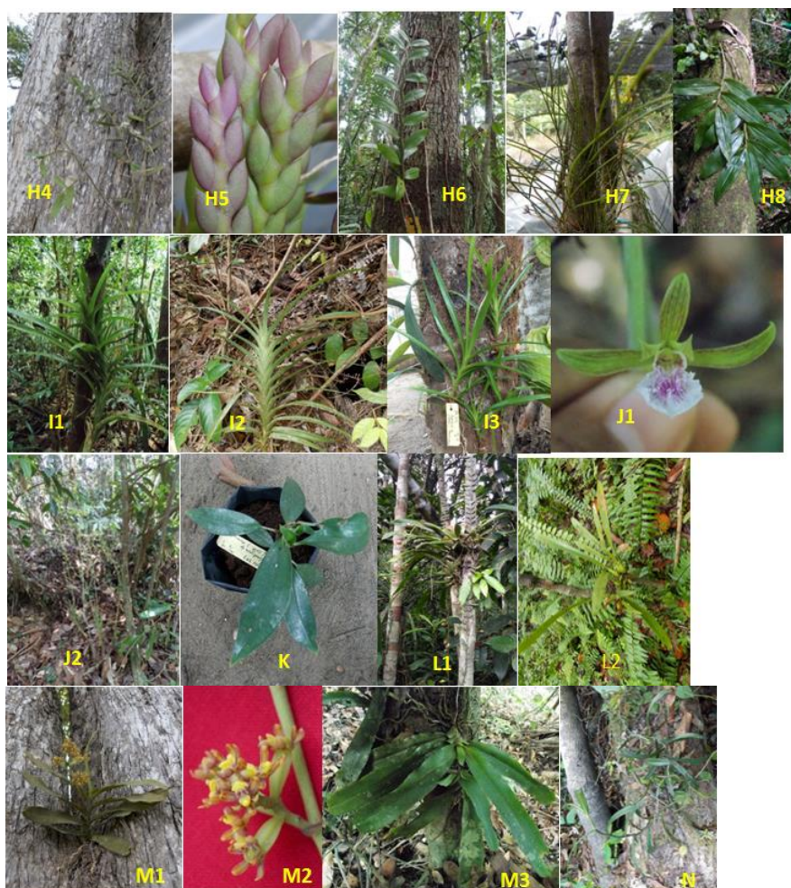
Gambar 3. A. Acriopsis liliifolia (A1: EM 83; A2: EM 84; A3: EM 89, A4: THJ 237); B. Agrostophyllum stipulatum (B1: THJ 173; B2-B3: THJ 243; B4: THJ 287); C. Bromheadia finlaysoniana (C1: AWB 003; C2: THJ 280; C3: YN 395; C4: YN 396). D1. THJ 157 Bulbophyllum aff. flavescens (Blume) Lindl; D2: THJ 171 B. aff. macranthum ; D3: THJ 170 B. aff. pahudi ; D. B. brienianum , D4-D5: THJ 236, D6: THJ 241; D7: THJ 232 B. macranthum ; D8-D9. B. purpurascens , D10-D15 Bulbophyllum sp., D10: THJ 146, D11: THJ 162, D12: THJ 164, D13: THJ 169, D14: AWB 001, D15: THJ 233; E1-E2 Calanthe triplicata ; F. Claderia viridiflora ; G. Cleisostoma subulatum ; G1: EM 061, G2: THJ 283; H. Dendrobium aloifolium , H1: THJ 176, H2: THJ 180, H3: THJ 195; H4. D. crumenatum ; H5. D. rosellum H6. D. secundum ; H7. D. setifolium ; H8. THJ 168 Dendrobium sp.; I. Dipodium sp., I1: THJ 166, I2: THJ 242, I3: YN 393; J1-J2 Eulophia graminea Lindl.; K. Goodyera rubicunda ; L1. Liparis parviflora , L2: EM 086 Liparis sp.; M1-M2. Pomatocalpa diffusum , M3. P. spicatum ; N. Trichoglottis sp.