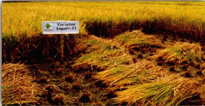
Gambar 2. Panen tanaman induk/utama

Kondisi lain yang harus diperhatikan pada tanaman utama adalah kondisi lahan yang tetap lembab (kapasitas lapang) pada saat dua minggu sebelum dan setelah panen. Pengaturan waktu panen yaitu saat masak fisiologis (bulir berwarna kuning 95%) dan batang masih hijau. Panen menggunakan sabit (sisa tanaman maksimal 25 cm dari permukaan tanah).