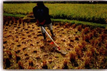
Gambar 6. Pematangan ulang