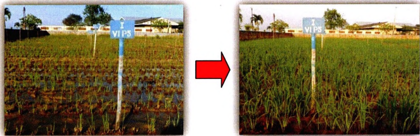
Gambar 3. Tanaman salibu pertama di KP Sukamandi (Dok. Abdulrachman, 2014)