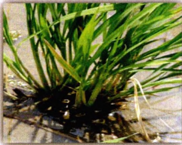
Gambar 8. Tunas salibu 30 HSP (Dok. Erdiman, 2013)