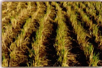
Gambar 5. Tunggul siap dipotong