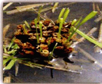
Gambar 7. Tunas salibu 7 HSP