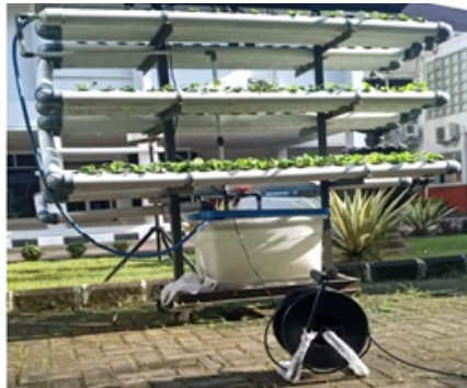
Gambar 2. Sistem hidroponik NFT tenaga listrik

Panas matahari merupakan salah satu energi alternatif terbarukan. Energi alternatif matahari bisa diubah menjadi energi listrik dengan bantuan panel surya. Panel surya memiliki rangkaian sel fotovoltaik yang mampu menghasilkan energi listrik yang selanjutnya disimpan dalam satu media penyimpanan yaitu baterai. Kemudian energi listrik dari baterai digunakan untuk menggerakkan pompa yang digunakan untuk sirkulasi nutrisi hidroponik sistem NFT. Sirkulasi aliran nutrisi yang kontinyu akan mempercepat pertumbuhan tanaman hidroponik