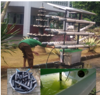
Gambar 5. Pemeliharaan sistem hidroponik NFT tenaga surya

tanaman lain lebih cepat. Pastikan tidak ada OPT yang merusak tanaman dan tidak ada tanda-tanda tanaman kekurangan zat nutrisi tertentu. Perhatikan pula peletakkan tanaman disesuaikan dengan kebutuhan radiasi matahari. Jenis tanaman berbentuk roset seperti sawi dan selada membutuhkan radiasi matahari penuh, terutama di pagi hari, sementara itu tanaman seperti kangkung dan bayam bisa diletakkan di tempat yang lebih sedikit radiasinya. Kontrol sistem NFT hidroponik tenaga surya secara keseluruhan yang baik akan meningkatkan kualitas produk sesuai dan meningkatkan harga jual produk (Gambar 6).