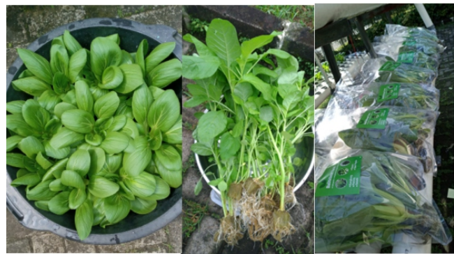
Gambar 6. Panen sayuran hidroponik