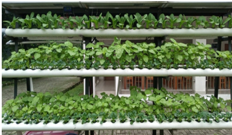
Gambar 4. Sistem hidroponik NFT tenaga surya

Sementara itu bak nutrisi kapasitas 200 liter digunakan dengan tujuan untuk menjaga kestabilan fluktuasi suhu, konsentrasi nutrisi dan pH terutama jika sistem hidroponik ditempatkan di luar ruangan ( outdoor )