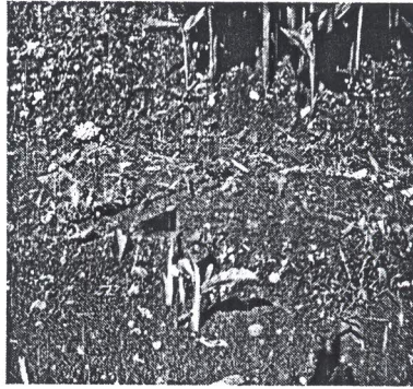
Gambar 5. Temu lawak perlakuan iradiasi 25 krad, 1 BST