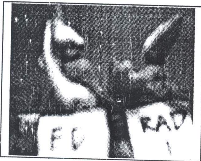
Gambar 1. Tunas pada perlakuan fresh drier dan iradiasi

Keterangan : Angka-angka pada kolom yang sama diikuti oleh huruf yang sama tidak berbeda nyata pada taraf 5 % menurut uji DMRT