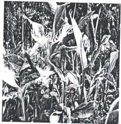
Gambar 4. Temu lawak perlakuan iradiasi 5 krad, 1 bulan tanam 1 BST