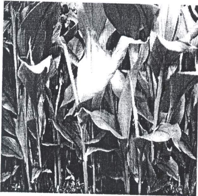
Gambar 3. Temu lawak pada penyimpanan fresh drier, 1 bulan tanam Fresh drier, 1 BST

Keterangan : Angka-angka pada kolom yang sama diikuti oleh huruf yang sama tidak berbeda nyata pada taraf 5 % menurut uji DMRT