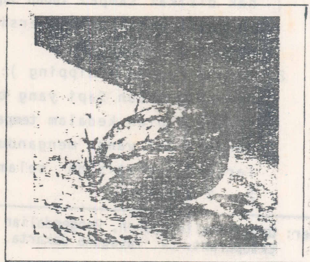
Gambar 1. Seekor Caplak ( Boophilus ) betina sedang makan sekenyang-kenyangnya ( gendut ).