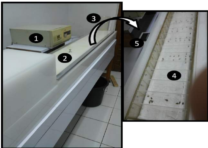
Gambar 2. Alat thermogradientbar. 1) pengatur on-off alat dan pengaturan suhu tertinggi dan terendah, 2) penutup alat thermogradientbar, 3) pengatur kelembapan alat, 4) kamar thermogradientbar, 5) thermometer

Perbedaan suhu yang bertahap memungkinkan seorang peneliti padi menyeleksi galur pada berbagai tingkat suhu. Selain seleksi, dapat pula diketahui rentang perkecambahan dan suhu optimum perkecambahannya. Bila dihubungkan dengan ketinggian tempat, maka suatu galur dapat diketahui rentang adaptasinya berdasarkan ketinggian tempat. Alat hasil karya Profesor benih Pusat Penelitian Biologi -LIPI, Prof. Hadi Sutarno, mulanya dirakit untuk mengidentifikasi persebaran ketinggian tempat spesies baru yang diperoleh dari lapangan. Sebagai spesies hutan yang belum banyak dikenal masyarakat, penting untuk mengetahui kemungkinan persebaran spesies tersebut. Kemudian, berdasarkan hasil yang diperoleh, dapat diputuskan area eksplorasi selanjutnya. Profil alat thermogradientbar ditampilkan pada Gambar 2.